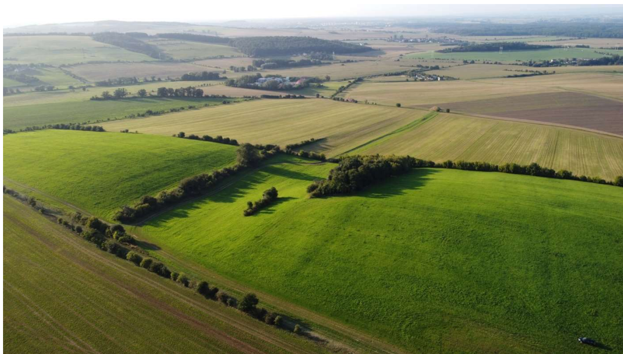
Obr. 3: Typická struktura krajinných prvků v popluží Nového Dvora u Kvasic

V 70. letech 20. století vzniklo v katastru obce Bělov odkaliště se struskovodem pro ukládání odpadů z teplárny Kučovaniny v Otrokovicích. Areál se postupně rozrostl i do katastru Nové Dědiny. Území, zasahuje do jižní části popluží Nového Dvora. Dle KN se obecně jedná z velké části o druh pozemku „ostatní plocha“, která se dělí na dva základní způsoby využití – jiné plocha a neplodná půda (další kategorií v pořadí je ostatní komunikace). Část odkaliště je rekultivována, část je dosud aktivní.