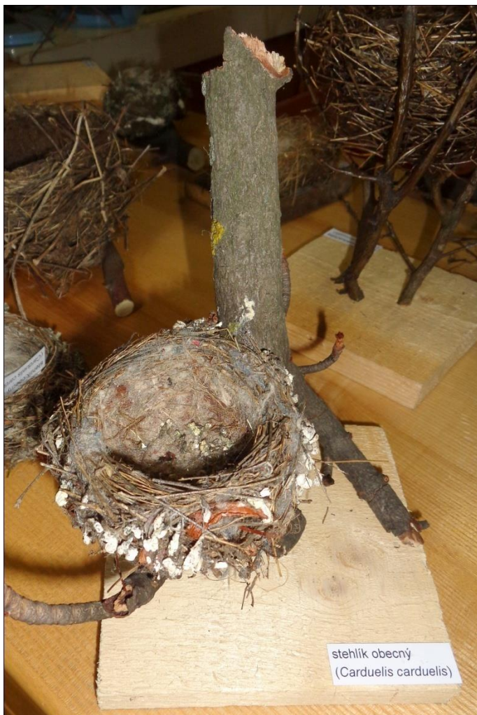
stehlík obecný ( Carduelis carduelis )