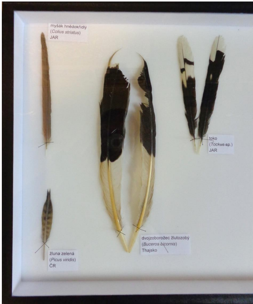
myšák hnědokřídly ( Colius striatus ) JAR