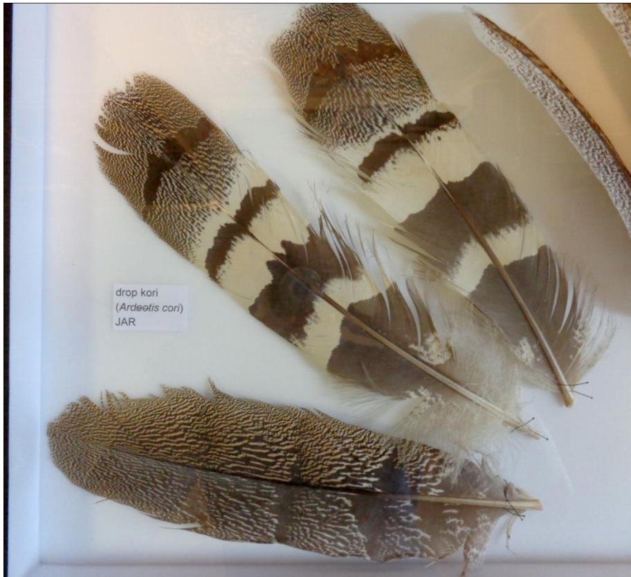
drop kori ( Ardeotis kori ) JAR