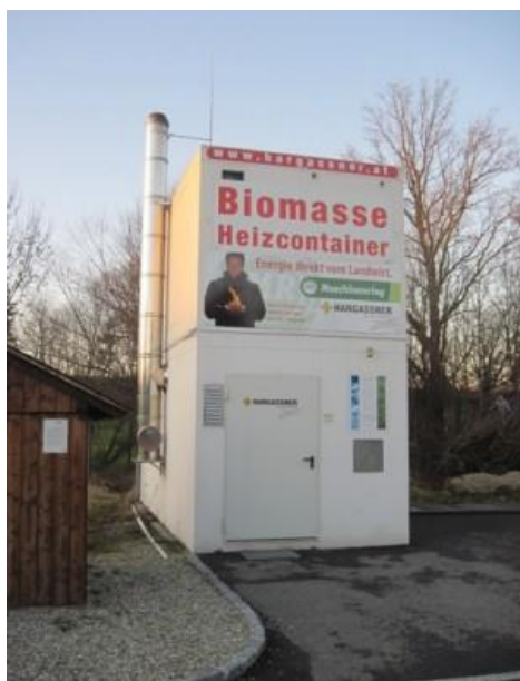
Obr. 2 Lidová škola Weng, Turn - Dvoupatrový kontejner na štěpku, výkon kotle 150 kW

Jako snadné řešení regionálního využívání biomasy jak z pohledu regionu (obce, města) tak z pohledu vlastníků a správců lesa i z pohledu investora, jako smluvního dodavatele tepla lze považovat řešení pomocí topných kontejnerů. Topné kontejnery jsou ideální kombinace řešení topení a skladovacího prostoru. Podle požadavku zákazníka mohou být topné kontejnery dodány v jednopatrové, dvoupatrové nebo třípatrové variantě. Zákazník ocení především příznivé cenově-stavební možnosti, úsporu místa, zjednodušení přestupu na biomasu a velkou variabilitu výkonů zvolených kotlů, jejich automatizaci a důmyslný plnicí systém. Řešení je ideální pro veřejné budovy, průmyslové závody, hotely nebo gastronomické a obytné budovy.