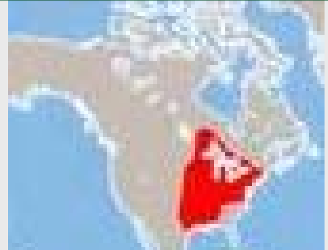
Původní rozšíření ORC ( Williams, 1990 )