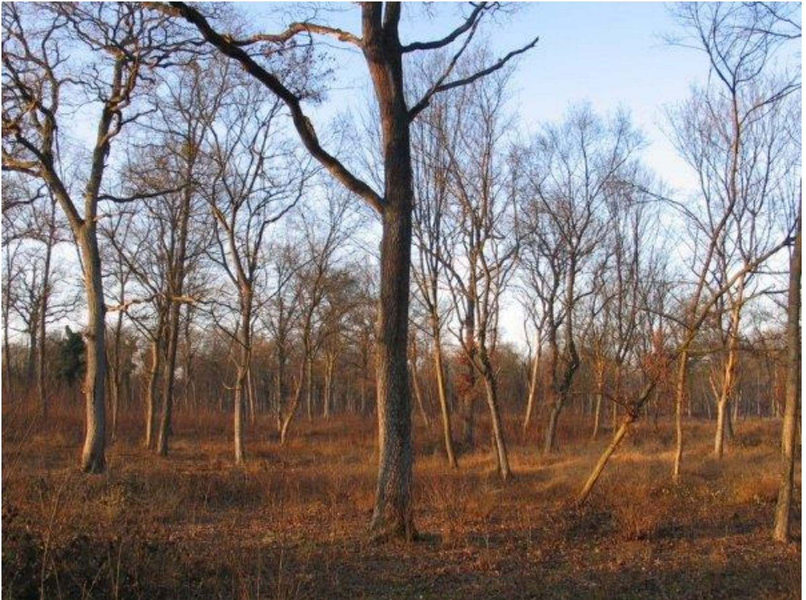
Biesheim, Francie (Alsasko), 2008