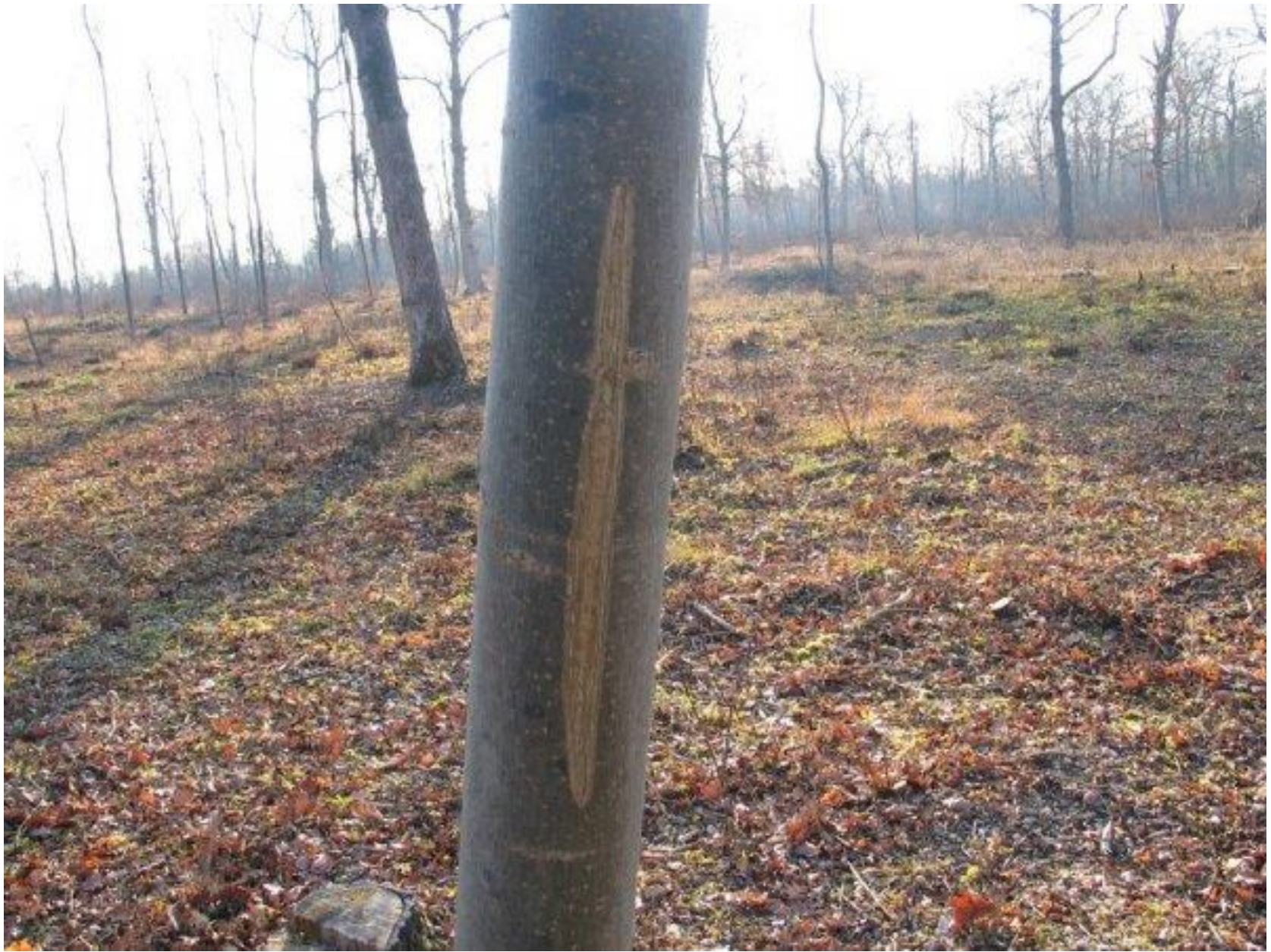
Biesheim, Francie (Alsasko), 2008