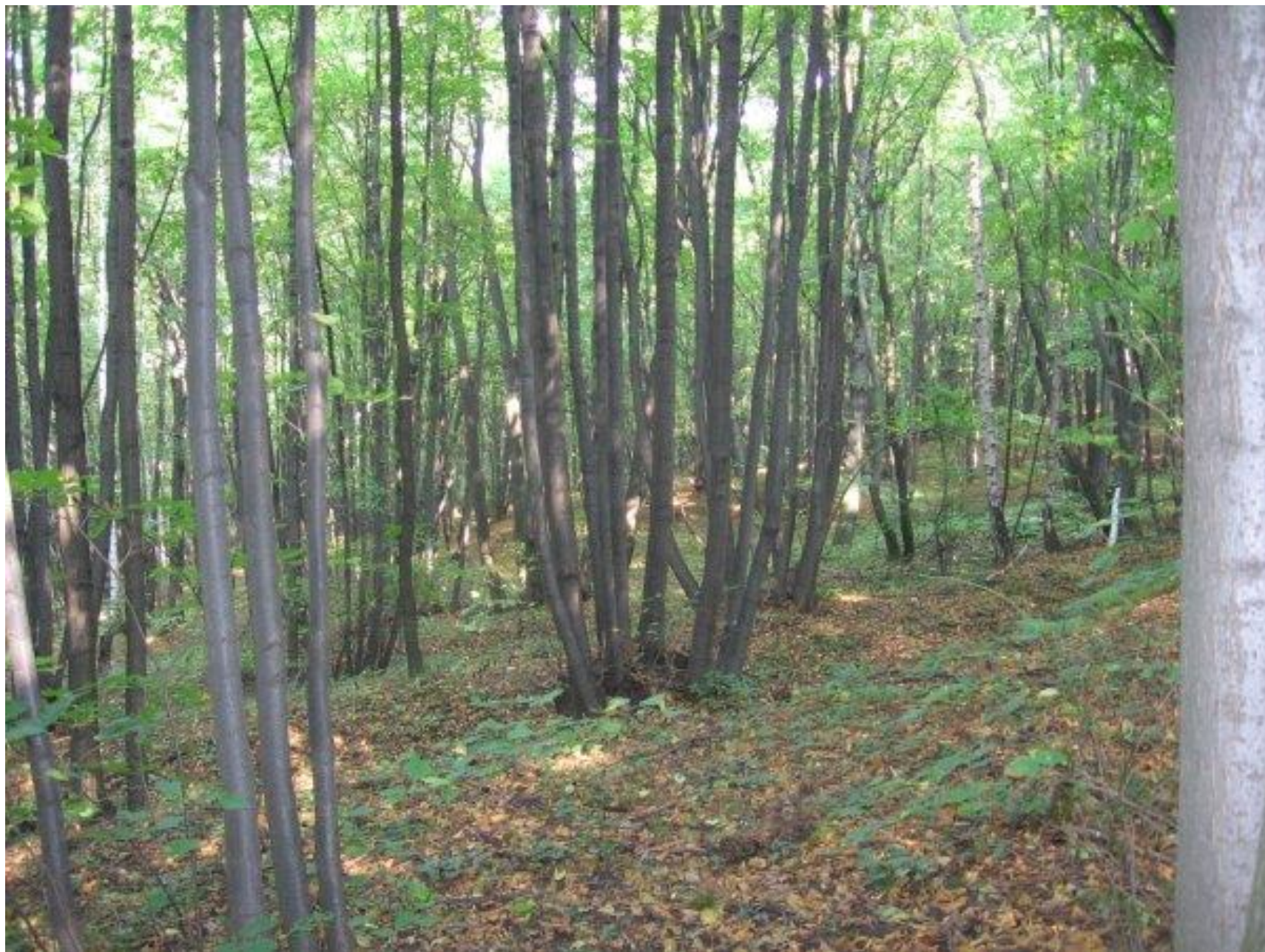
Pálava - Děvín, 2008