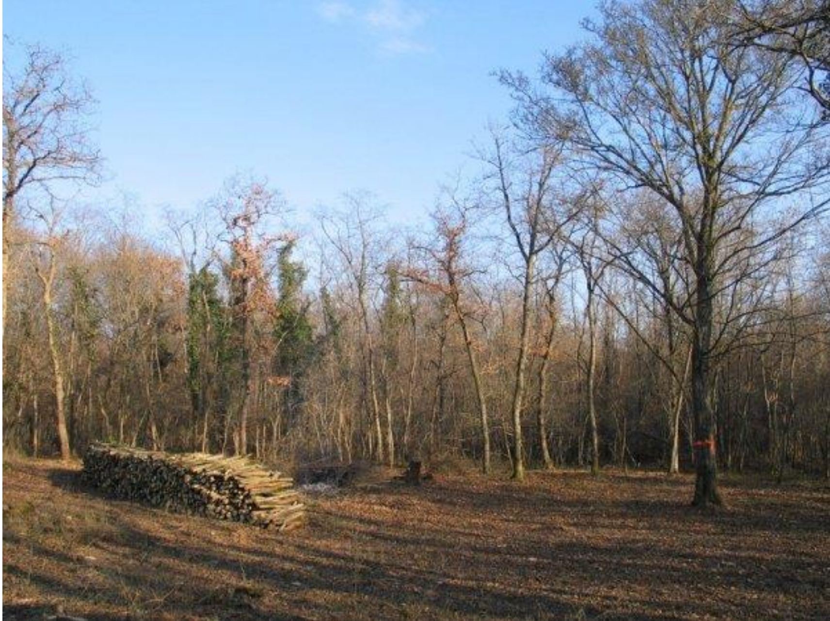
Biesheim, Francie (Alsasko), 2008