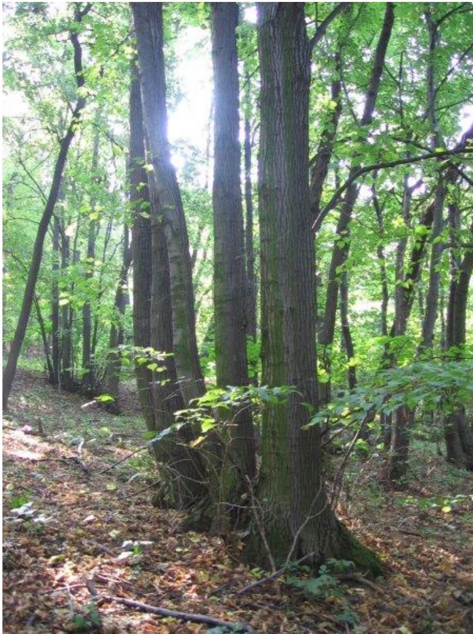
Pálava - Děvín, 2008