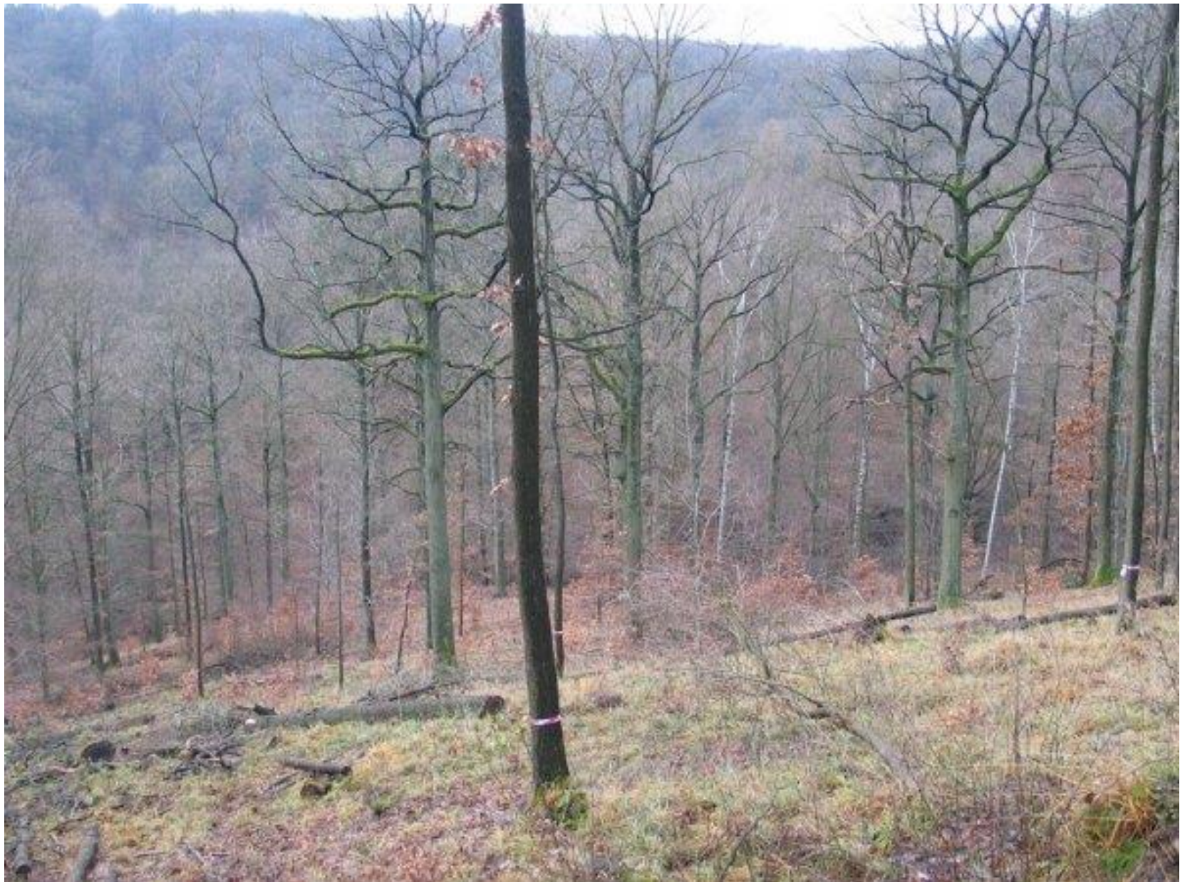
Iphofen, Německo (Bavorsko), 2008