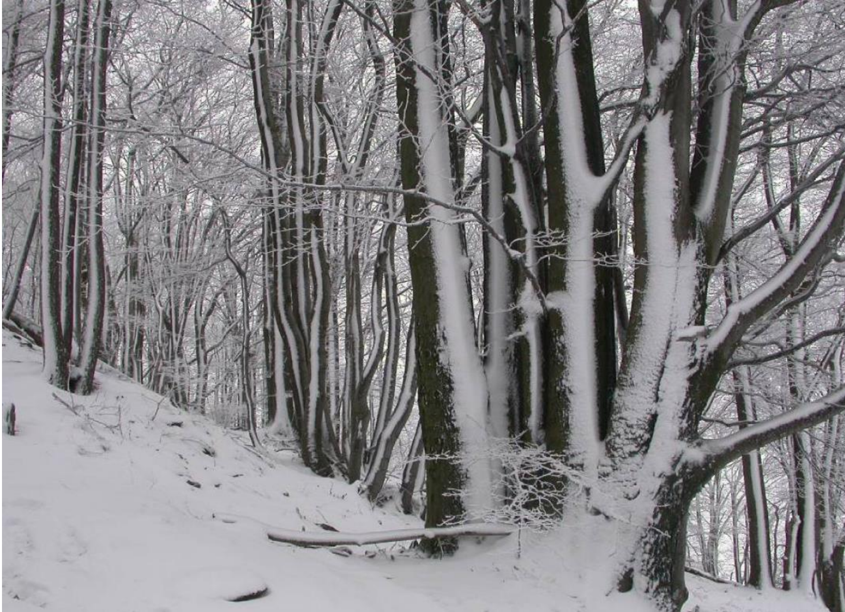
Fulnek, Novojičínsko 2009