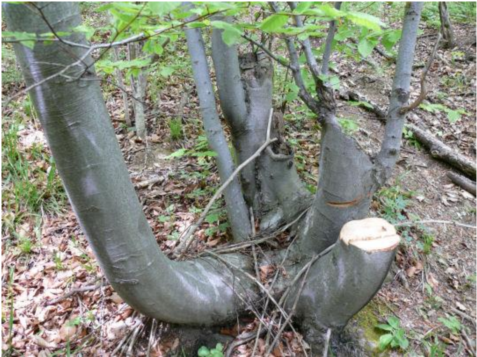
Svatá Kateřina, Rumunsko (Banát) 2008