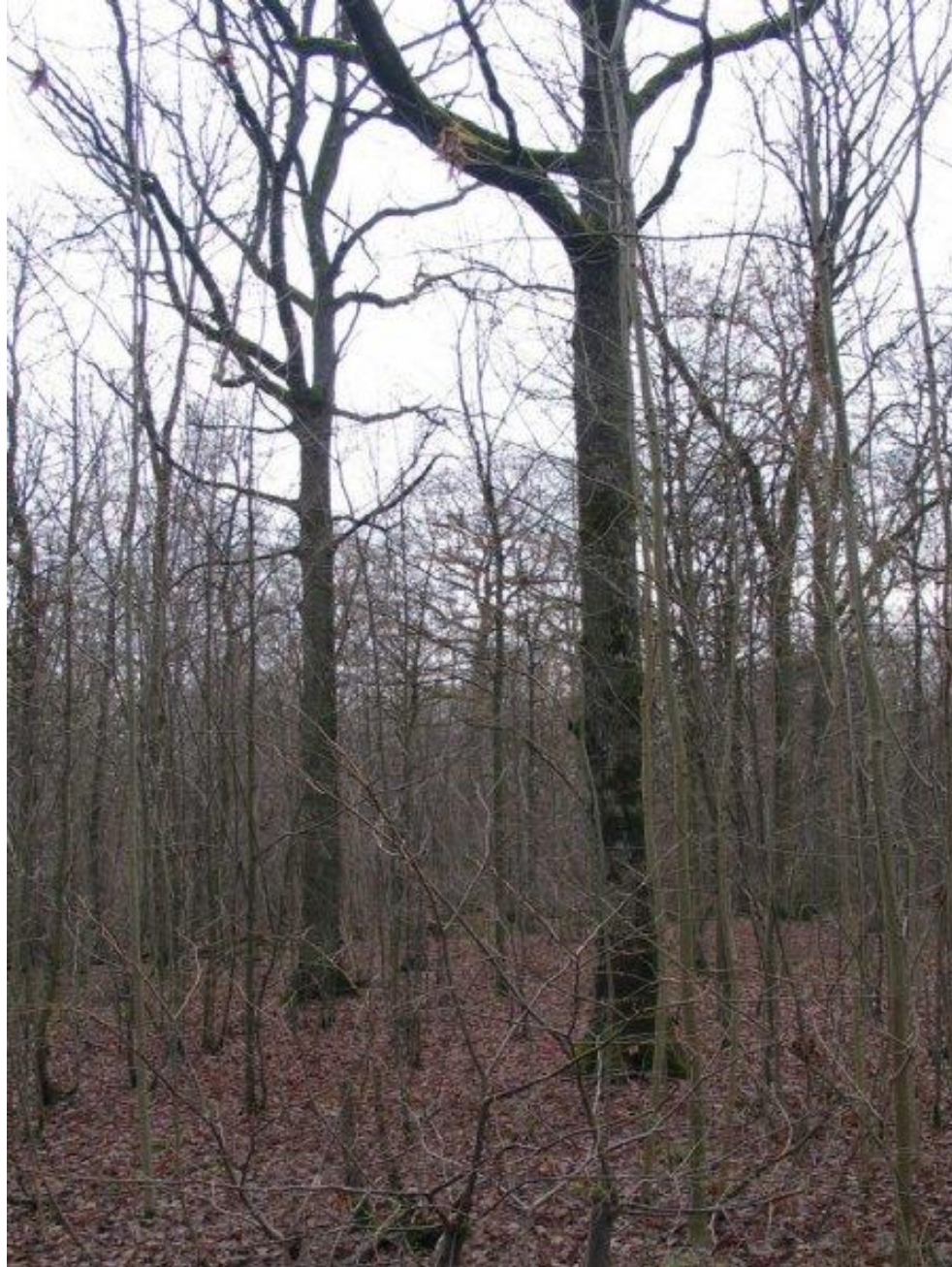
Iphofen, Německo (Bavorsko), 2008