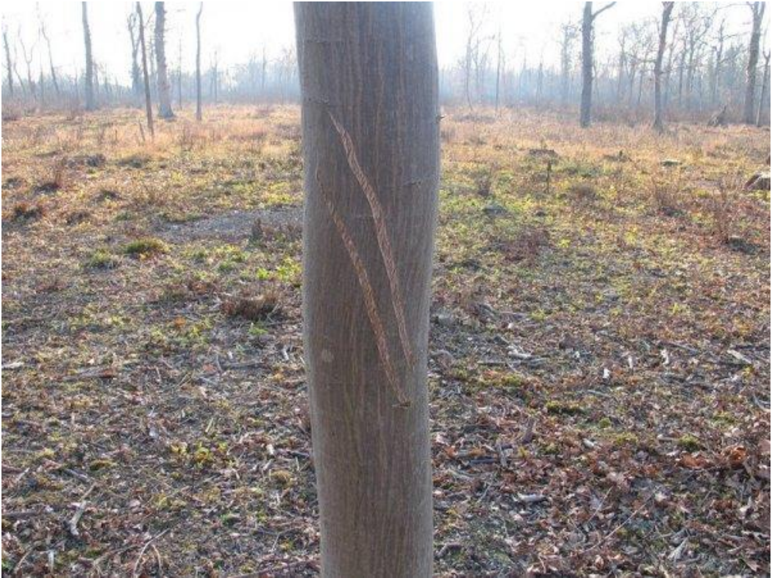
Biesheim, Francie (Alsasko), 2008