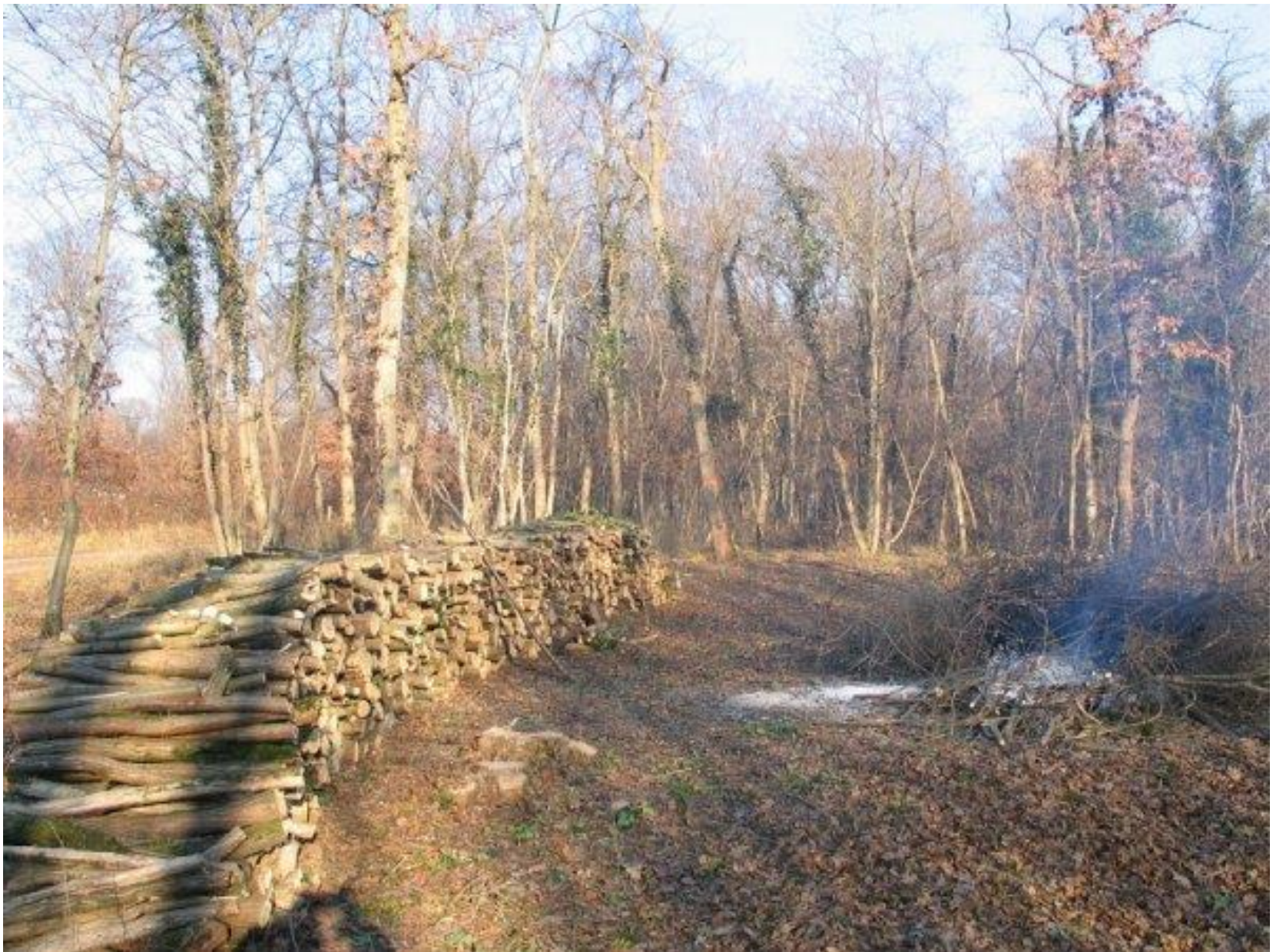
Biesheim, Francie (Alsasko), 2008