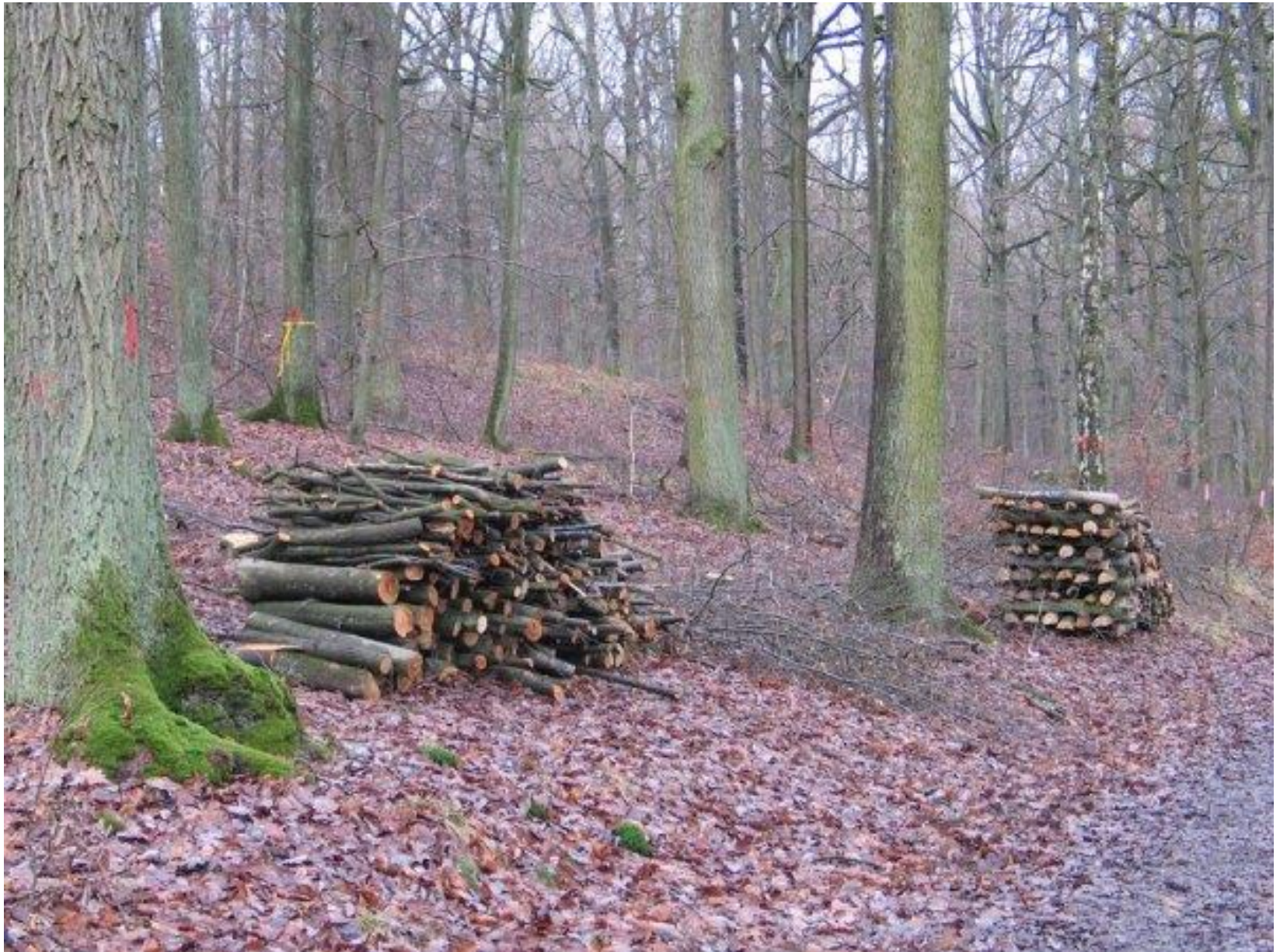
Iphofen, Německo (Bavorsko), 2008