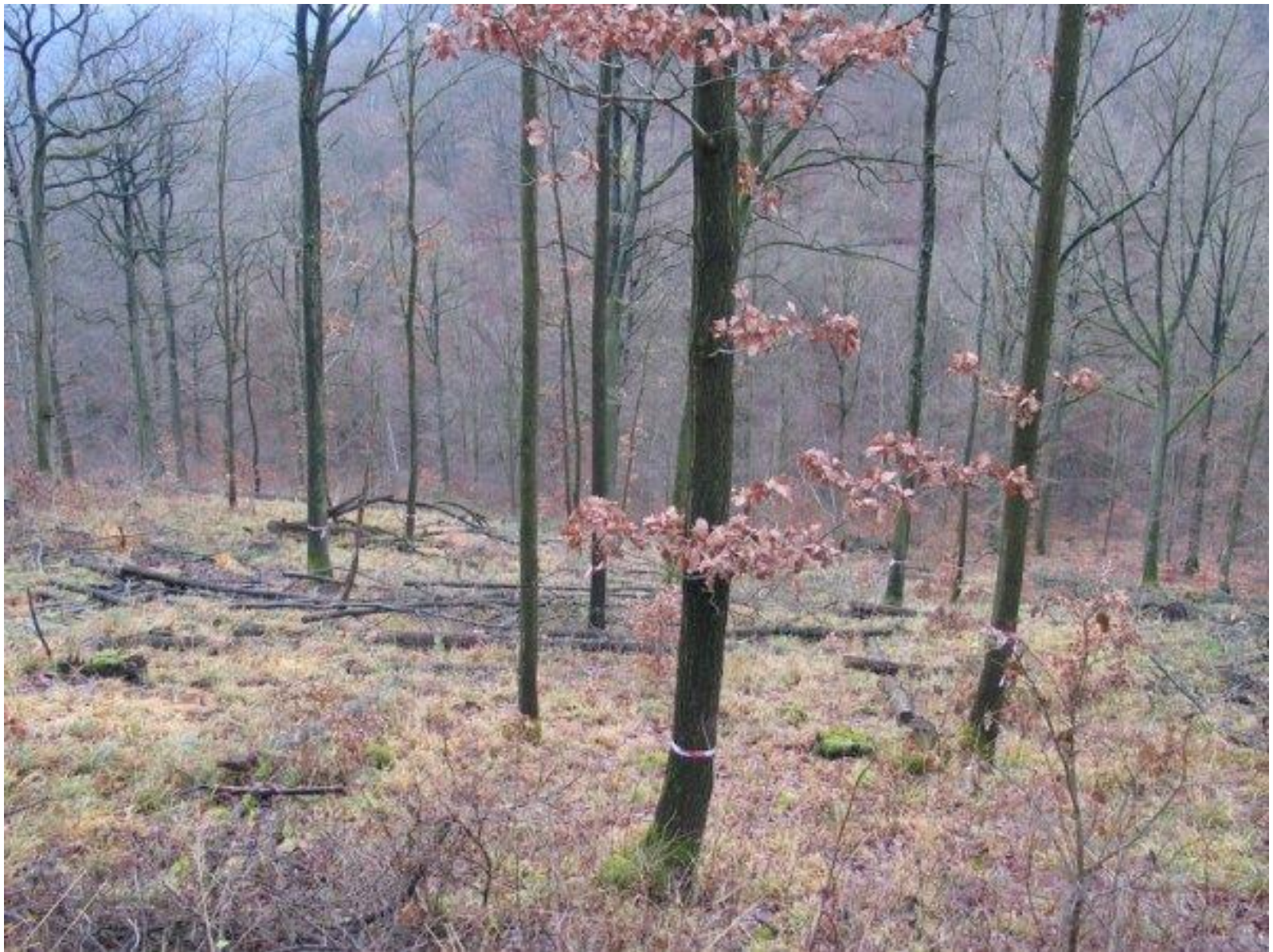
Iphofen, Německo (Bavorsko), 2008