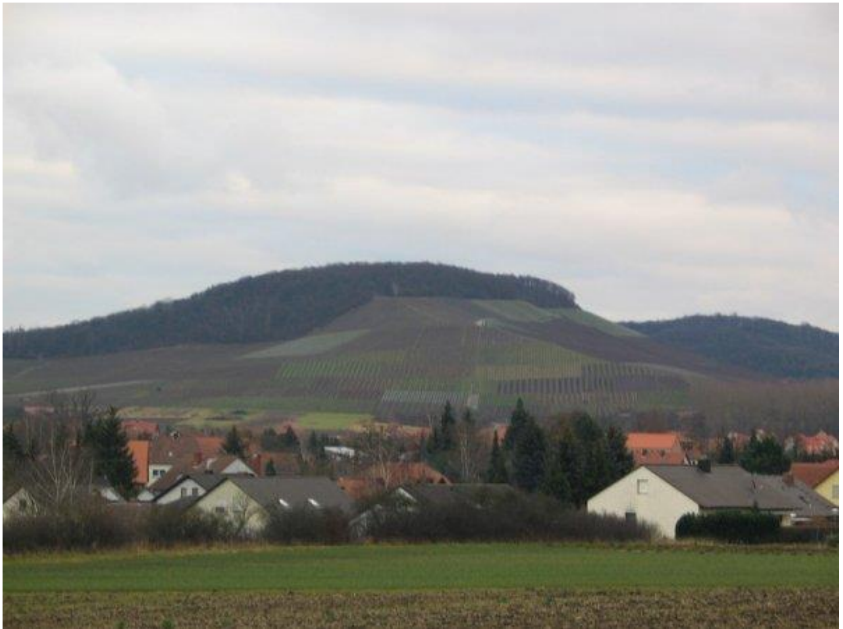
Iphofen, Německo (Bavorsko), 2008