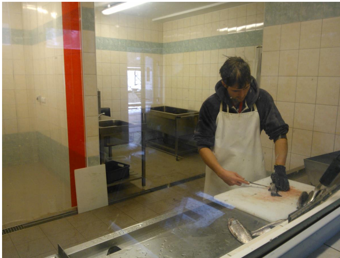
Pohled do zpracovatelské části z prodejny