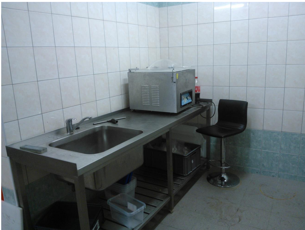
Manipulační pult s vakuovačkou