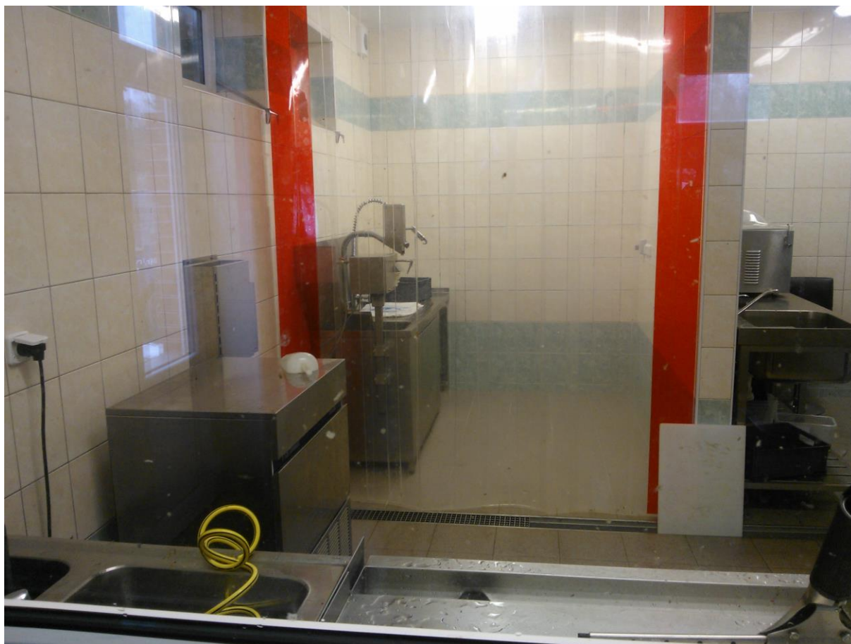
Pohled na část kuchání