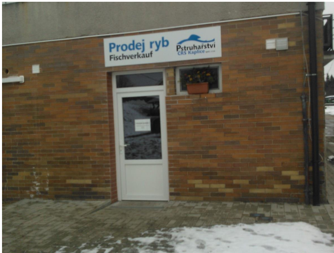
Prodejna ČRS Kaplice