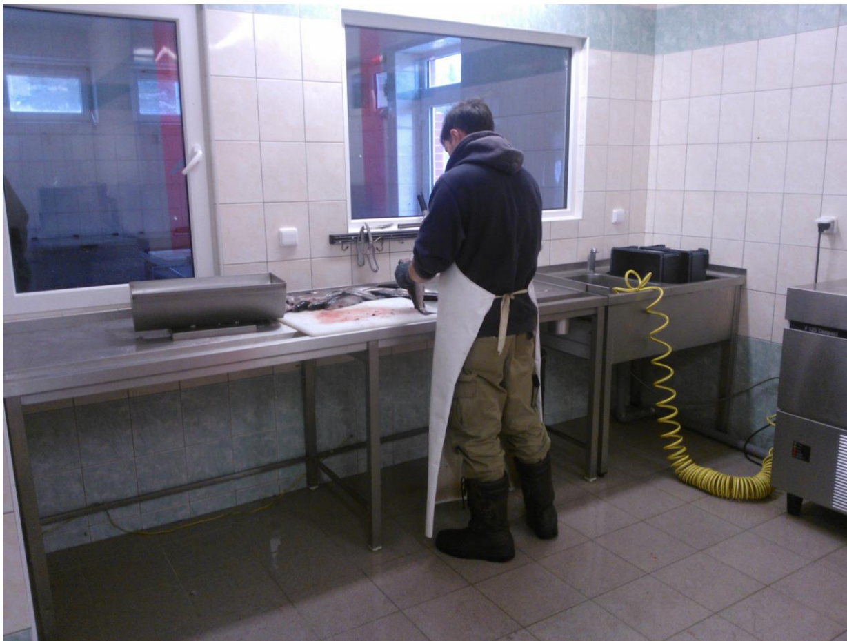
Pracovní pult na kuchání ryb