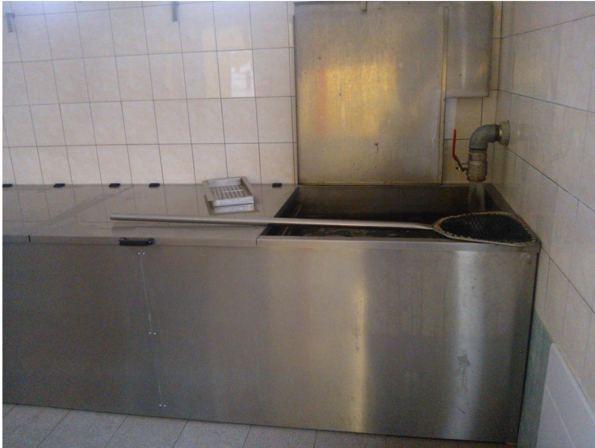
Prodejní žlab na přechování živých ryb