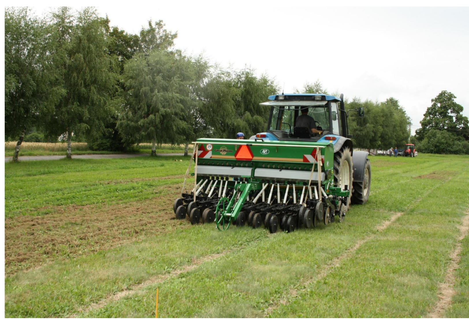
Přísevy travních porostů