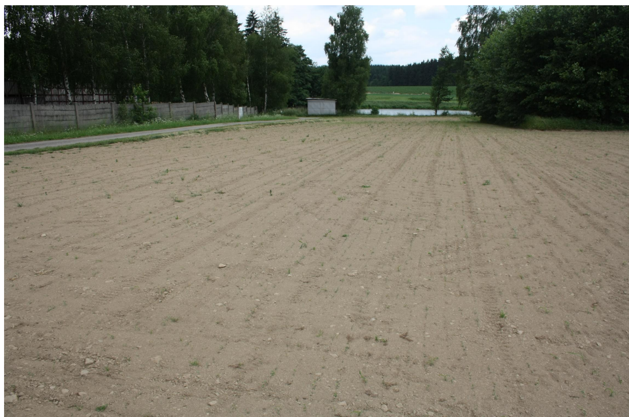
Nově založené pokusy semenářských porostů jetelovin