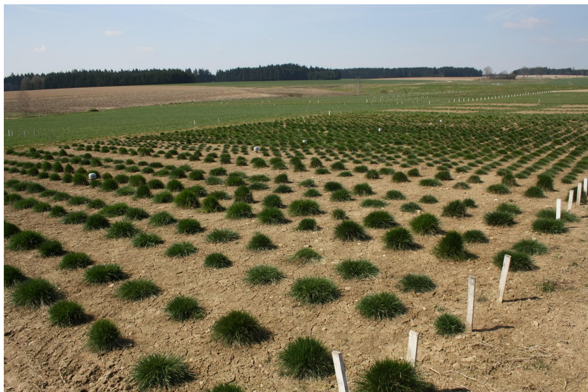
Vliv mikroklimatu na výskyt rzí u trávnickových odrůd trav