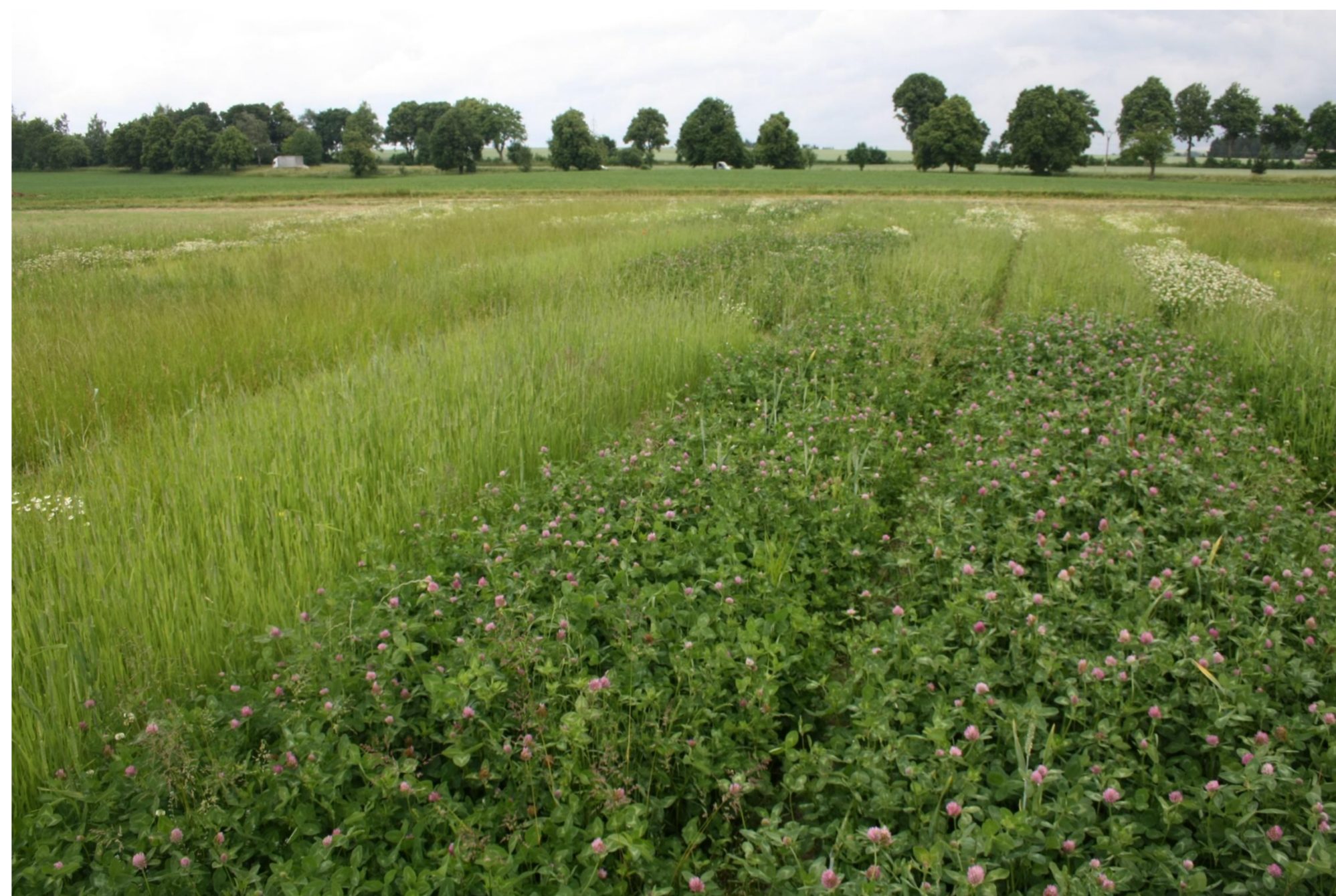
Vliv digestátu na trvalé kultury trav a jetelovin