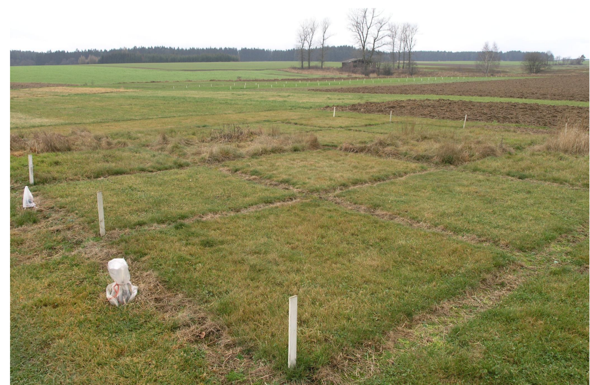
Vliv způsobu využití na travní ekosystém