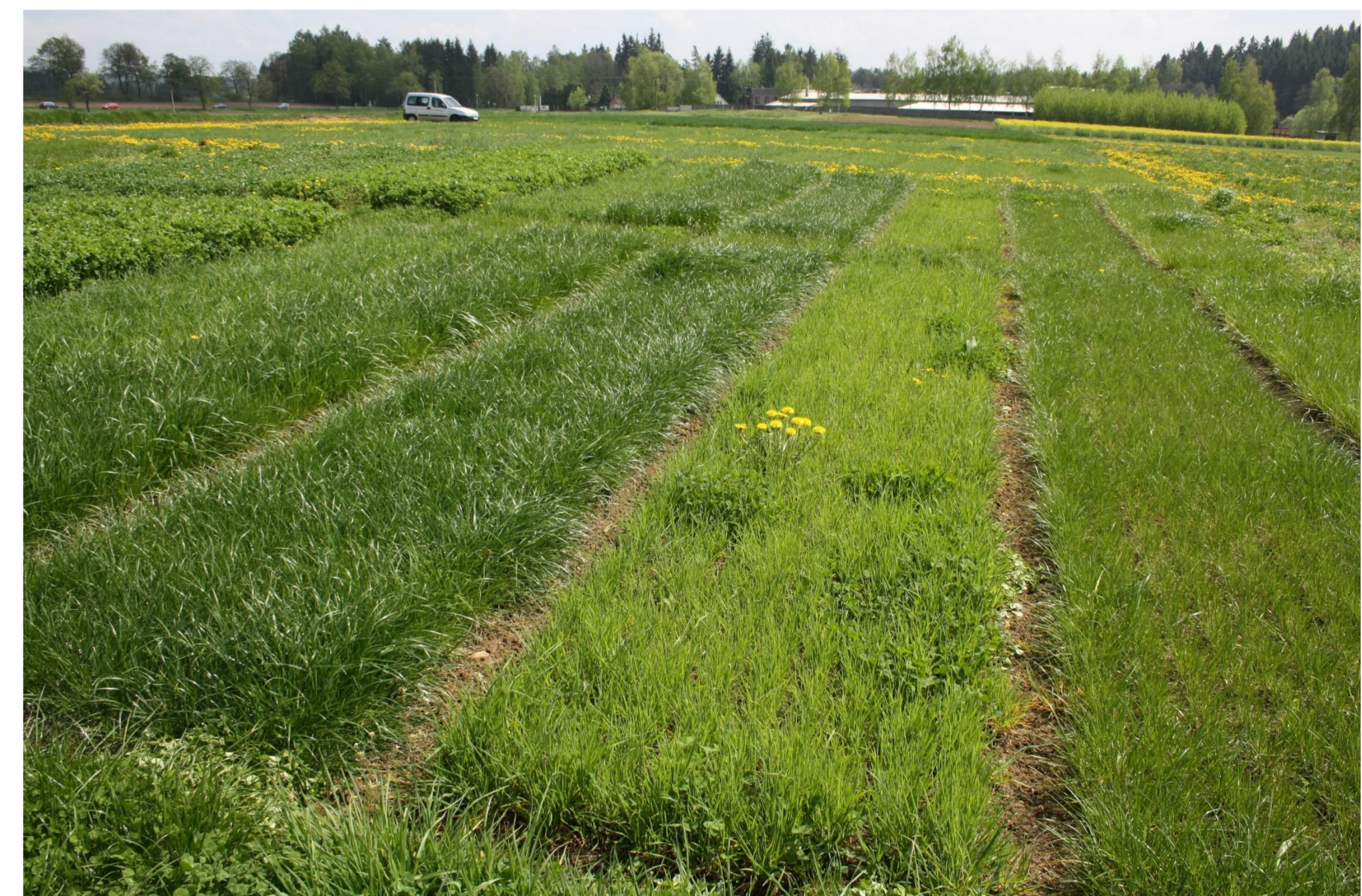
Kvalita píče vytrvalých trav a jetelovin