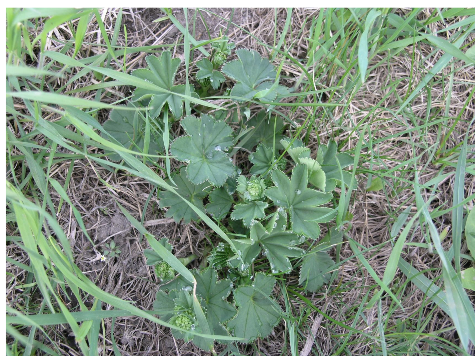
Kontryhel obecný Alchemilla pratensis Bus, non L.