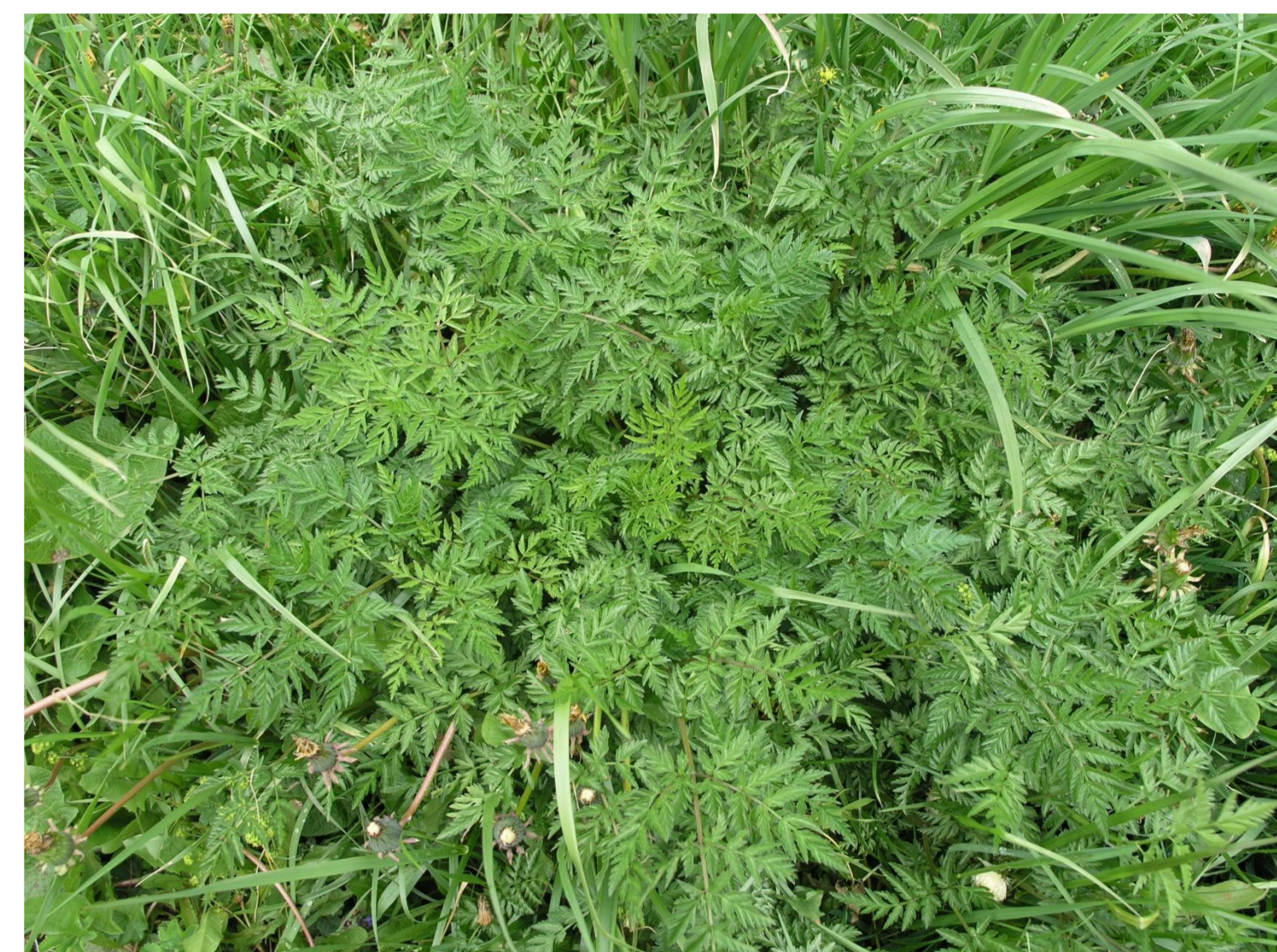
Kerblík lesní Anthriscus sylvestris (L.) Hoffm.