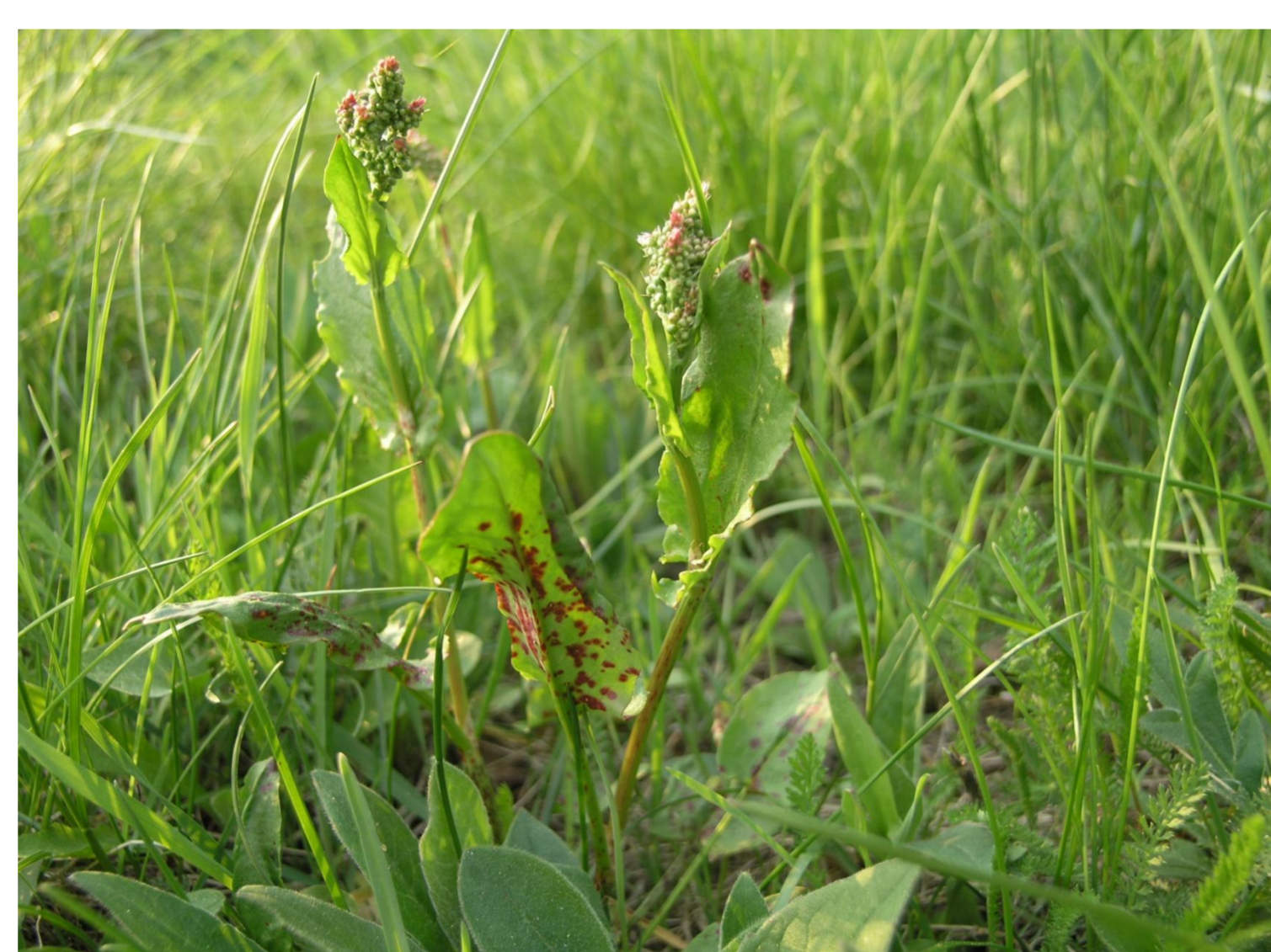
Šťovík kyselý Rumex acetosa L.