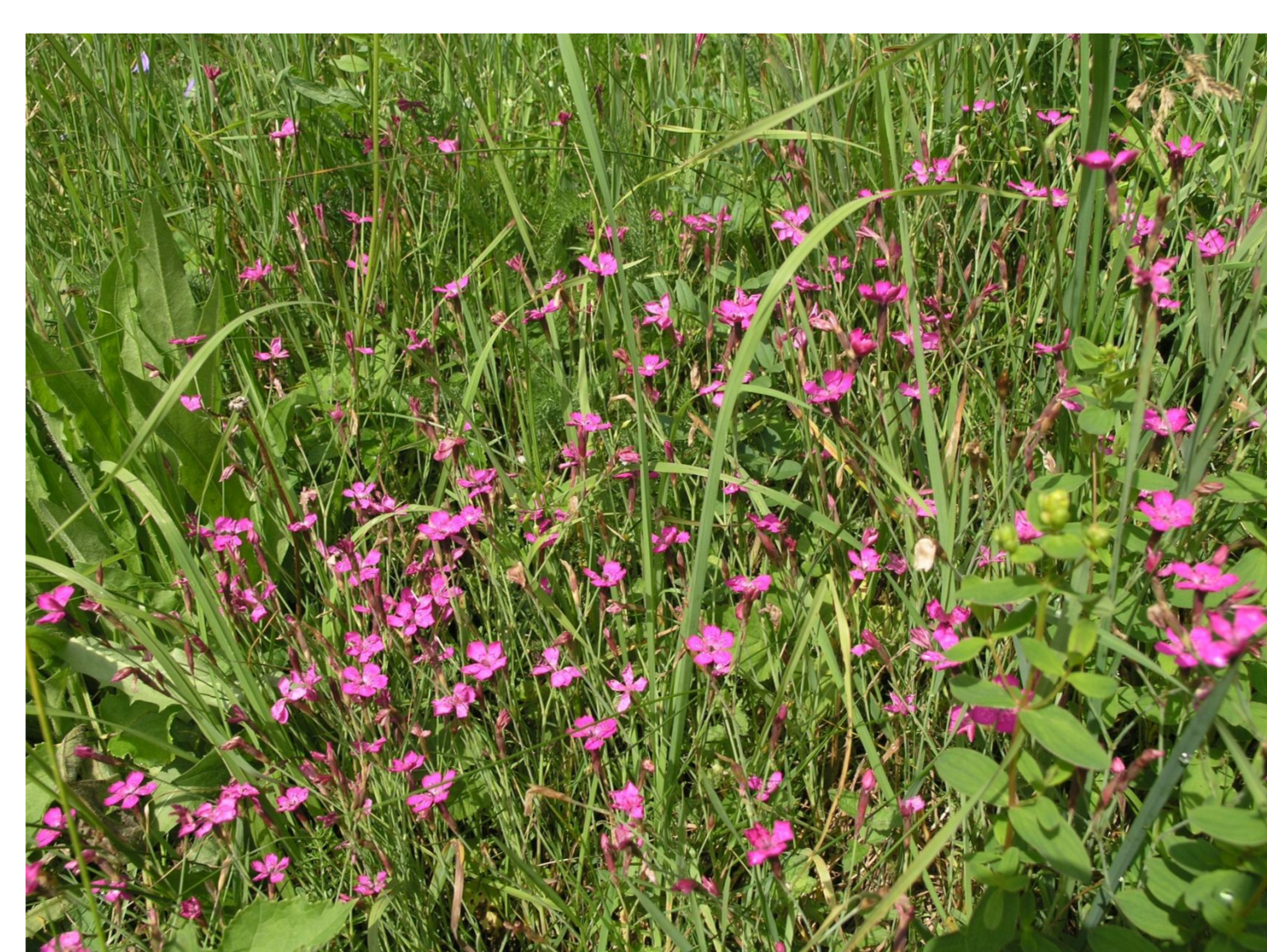
Hvozdík kropenatý Dianthus deltoides L.