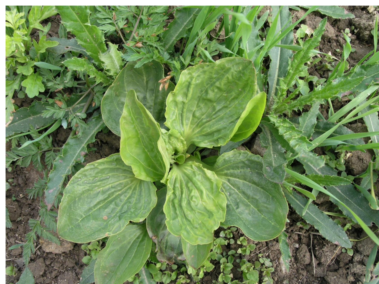
Jitrocel větší Plantago major L.