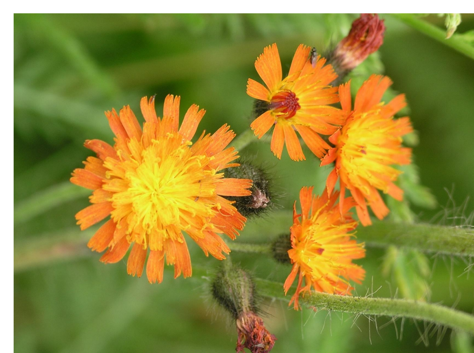
Jestřábník oranžový Hieracium aurantiacum L.