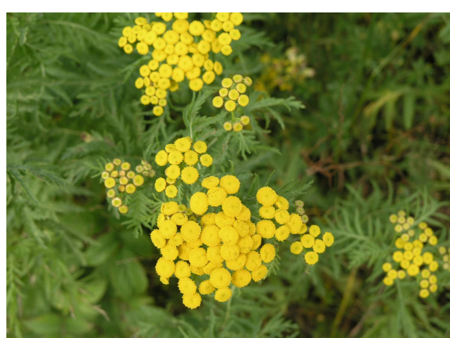
Vrtič obecný Tanacetum vulgare L.