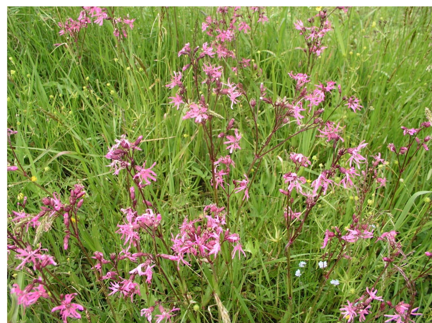
Kohoutek luční Lychnis flos-cuculi L.