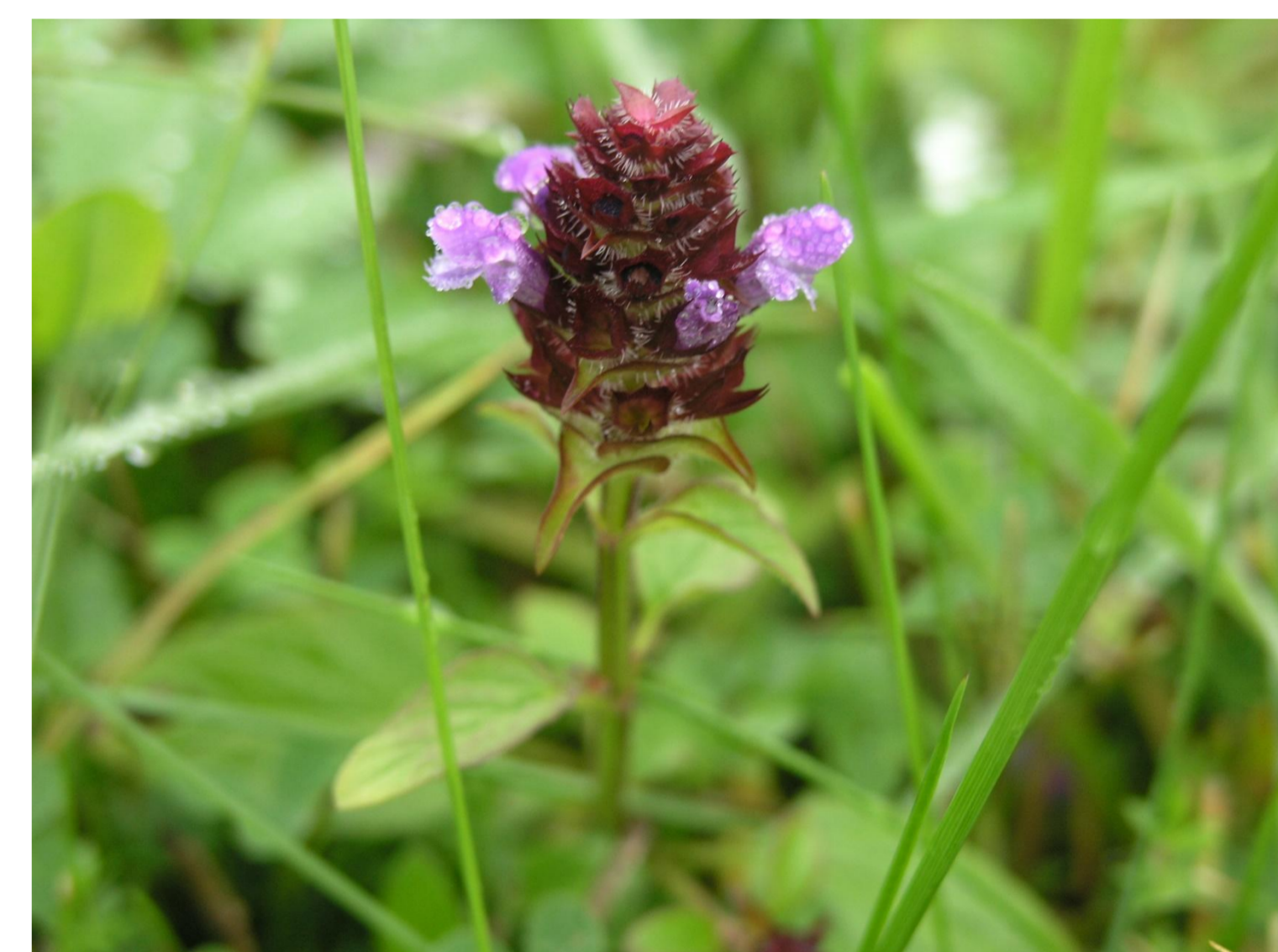
Černohlávek obecný Prunella vulgaris L.