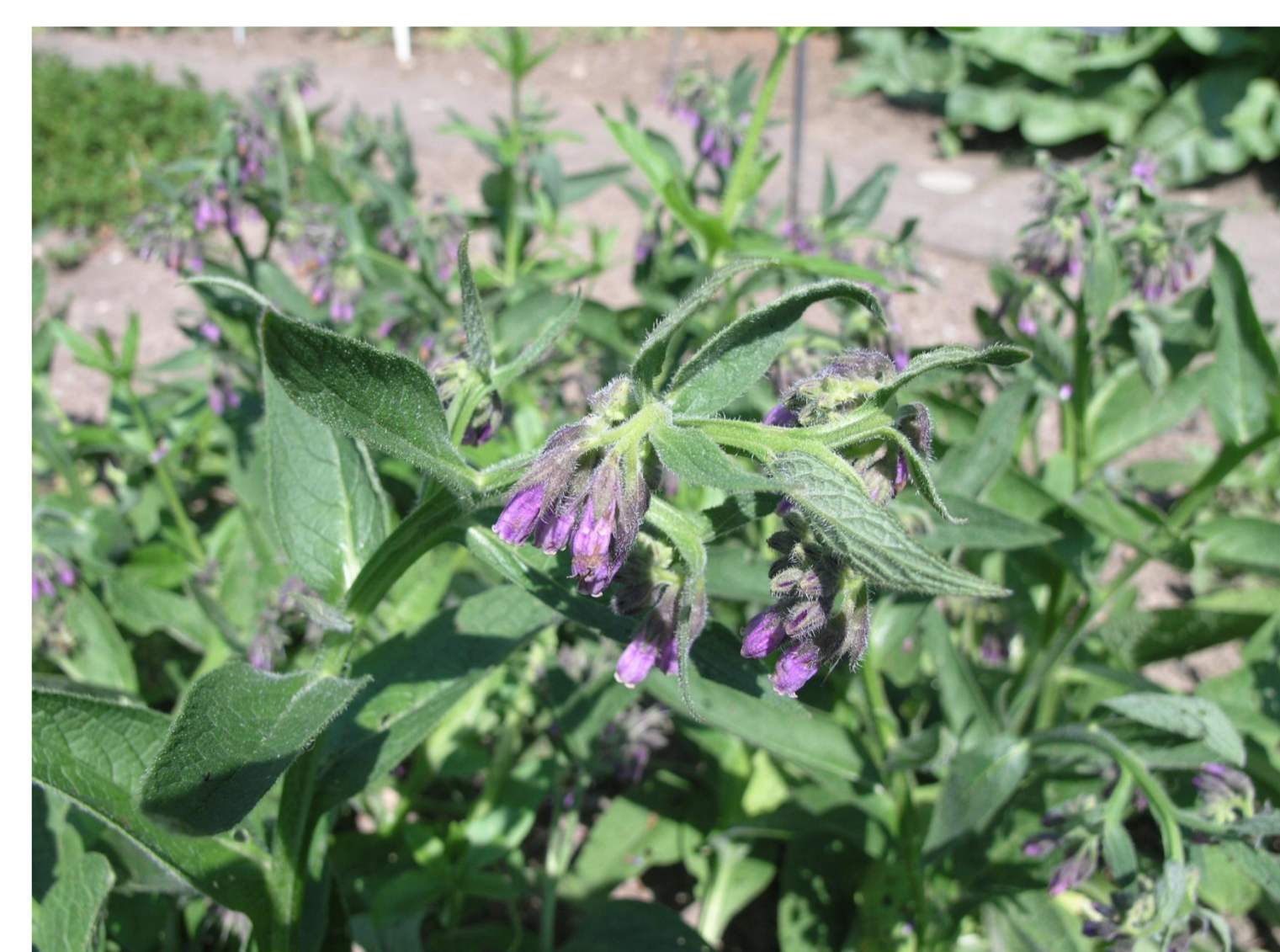
Kostival lékařský Symphitum officinale L.