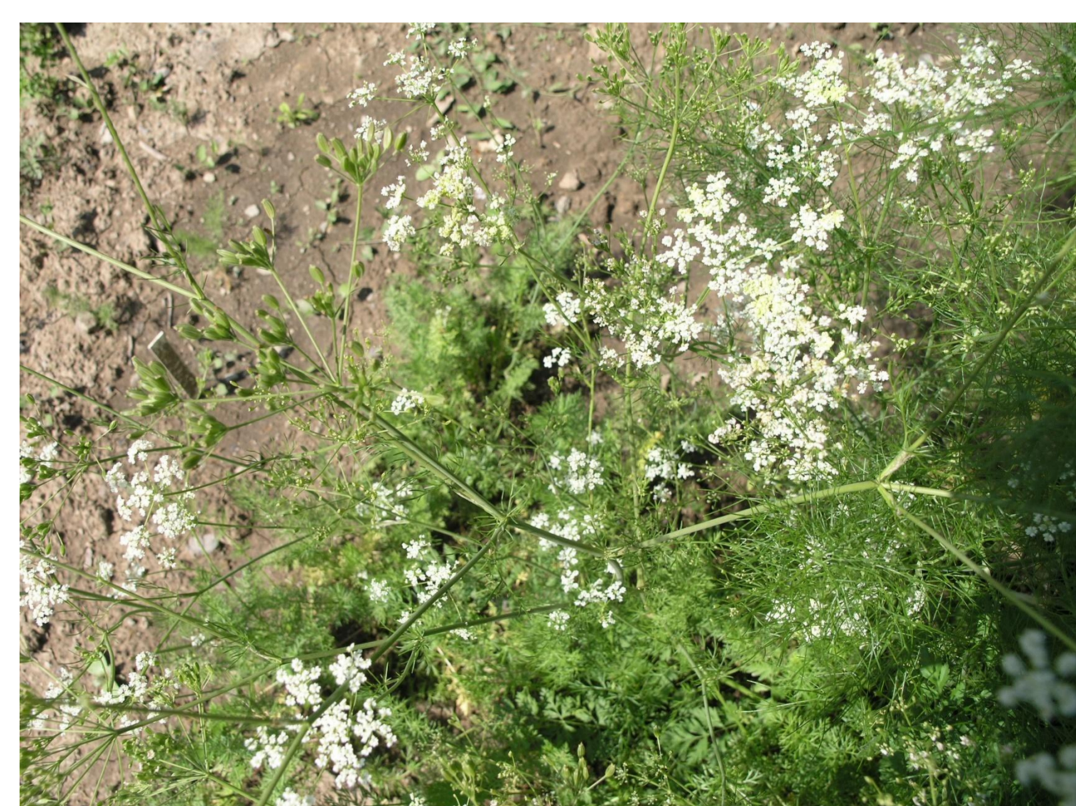
Kmín kořený Carum carvi L.