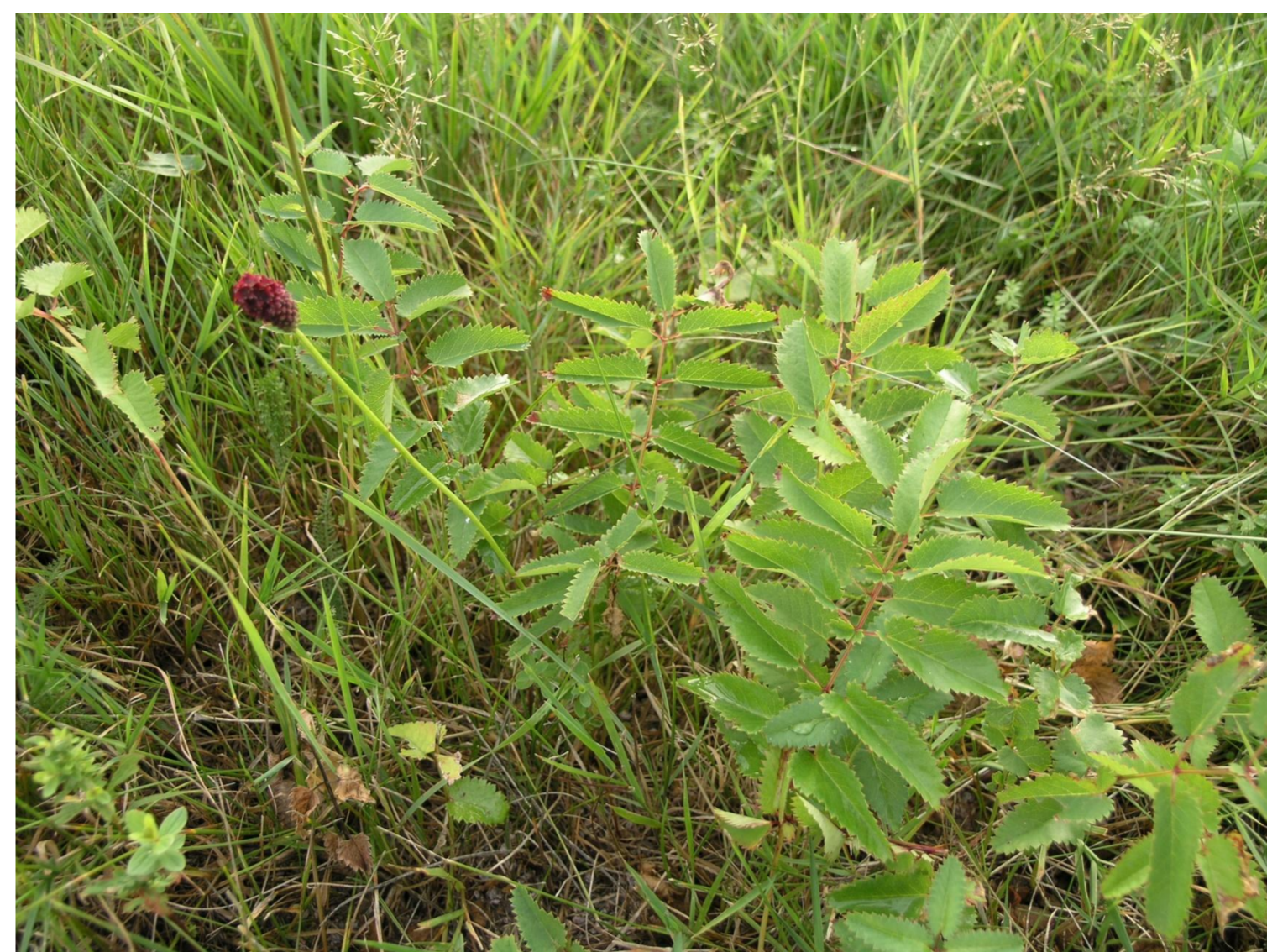
Krvavec toten Sanguisorba officinalis L.