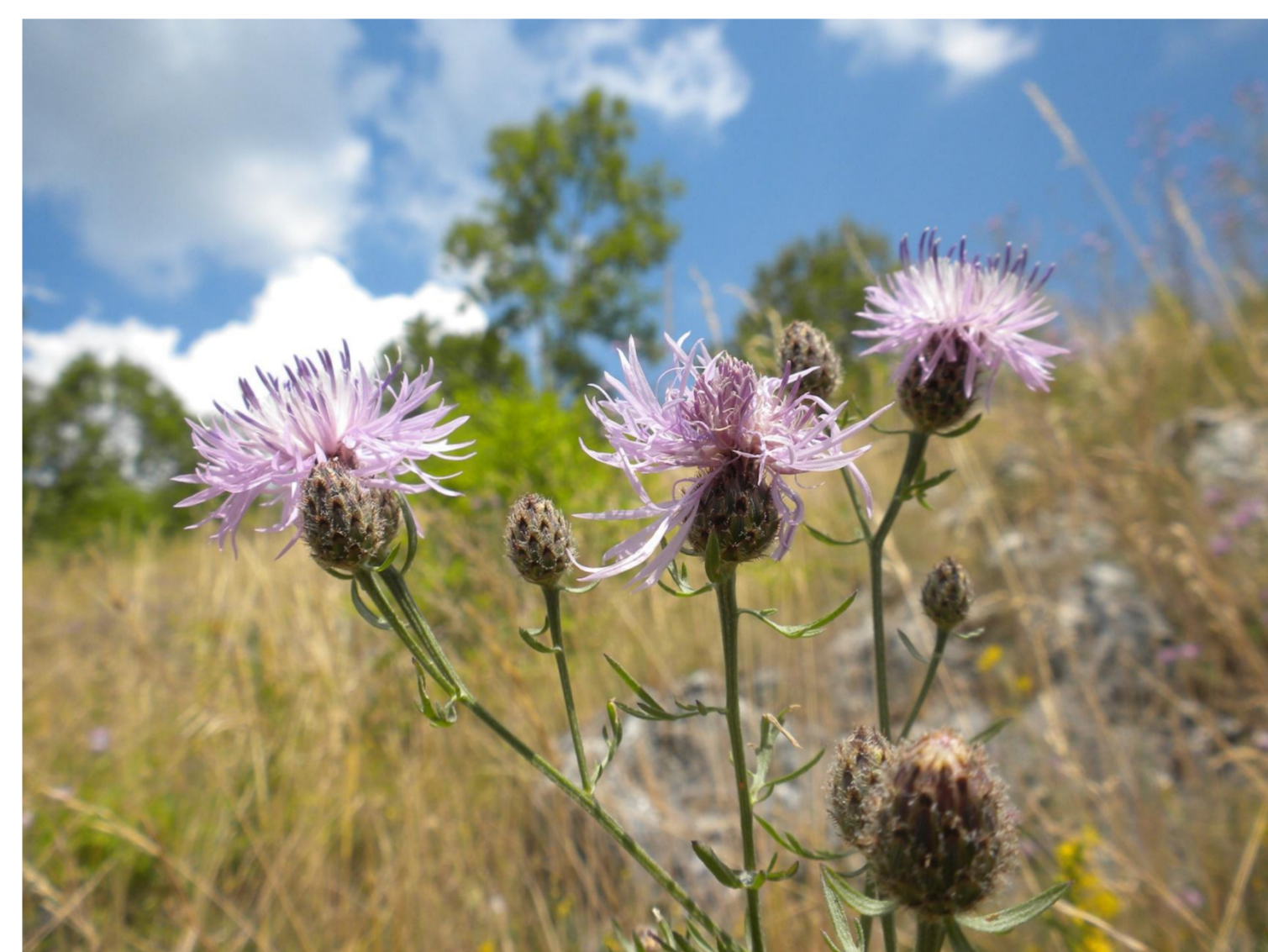
Chrpa čekánek Centaurea scabiosa L.