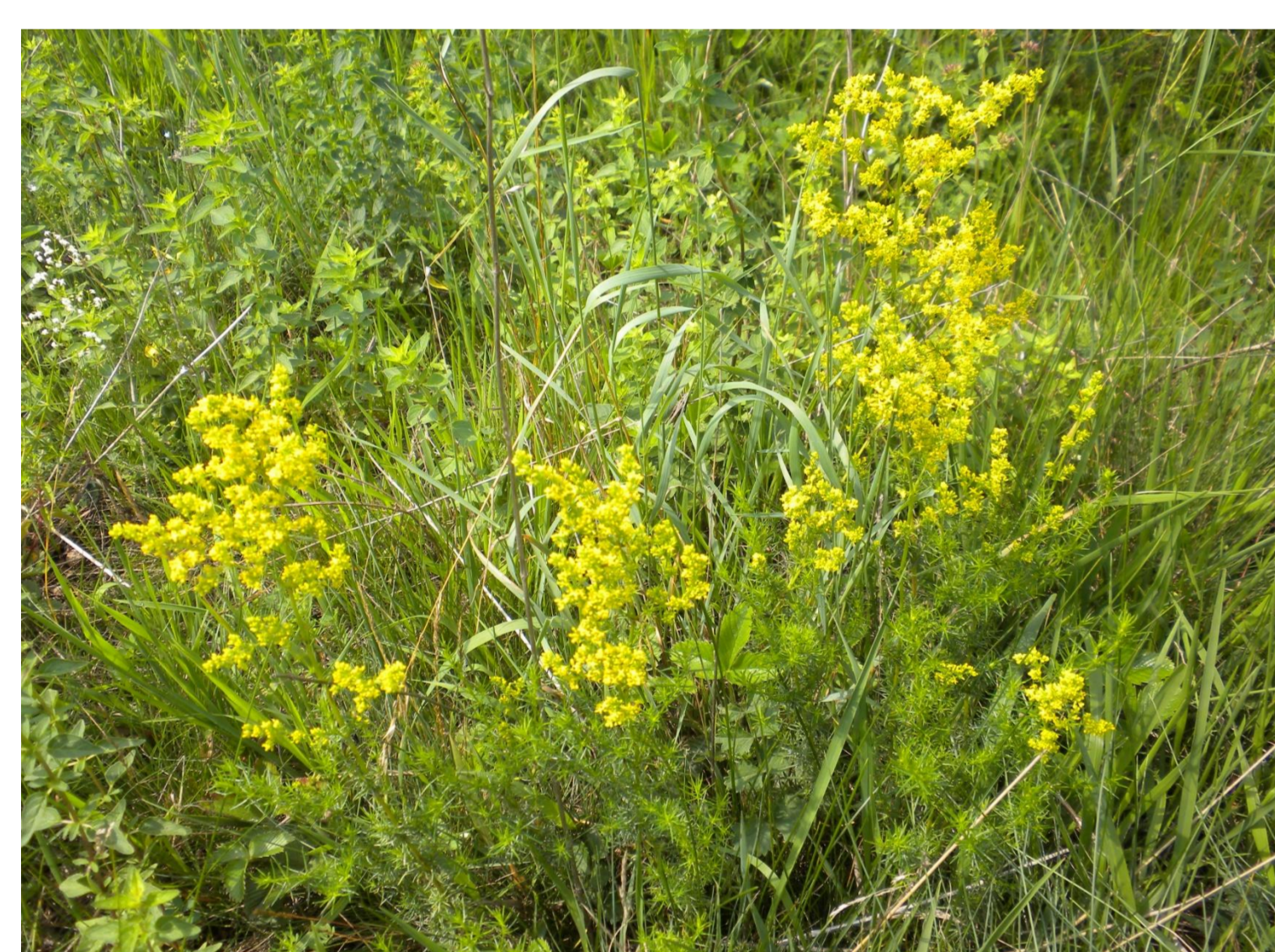
Svízel syříštový Galium verum L.