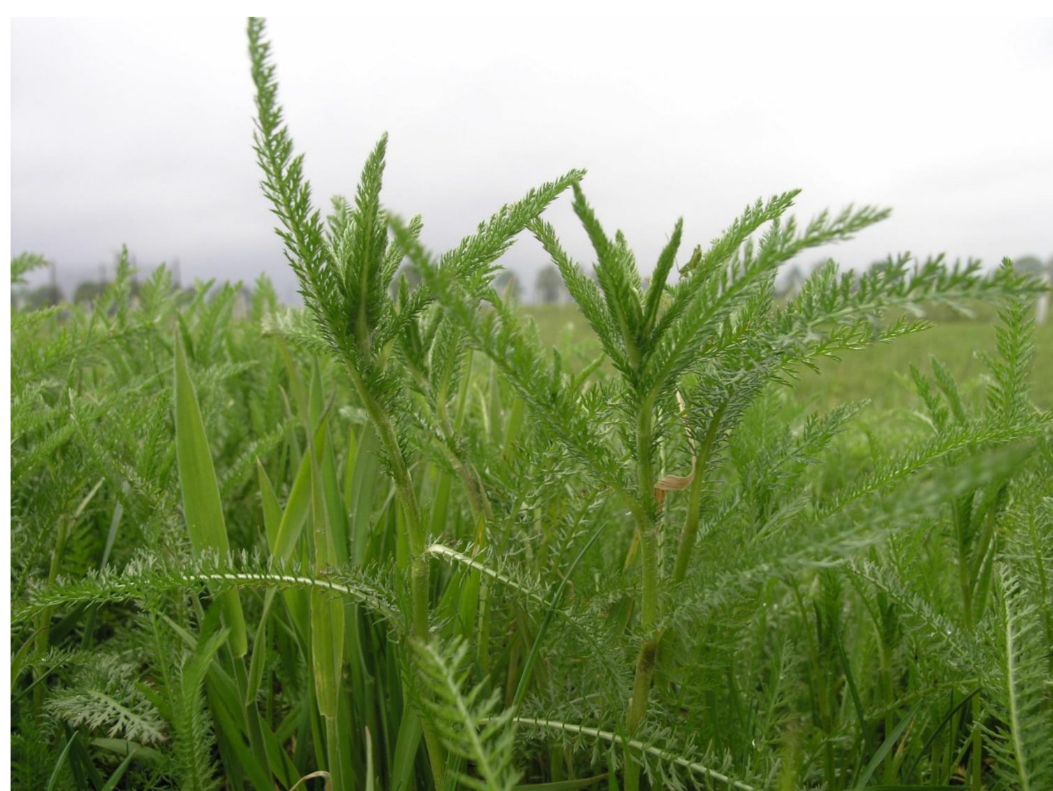
Řebříček obecný Achillea millefolium L.