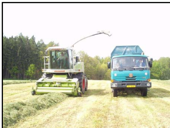
Obr. Sklízecí řezačka Claas Jaguar