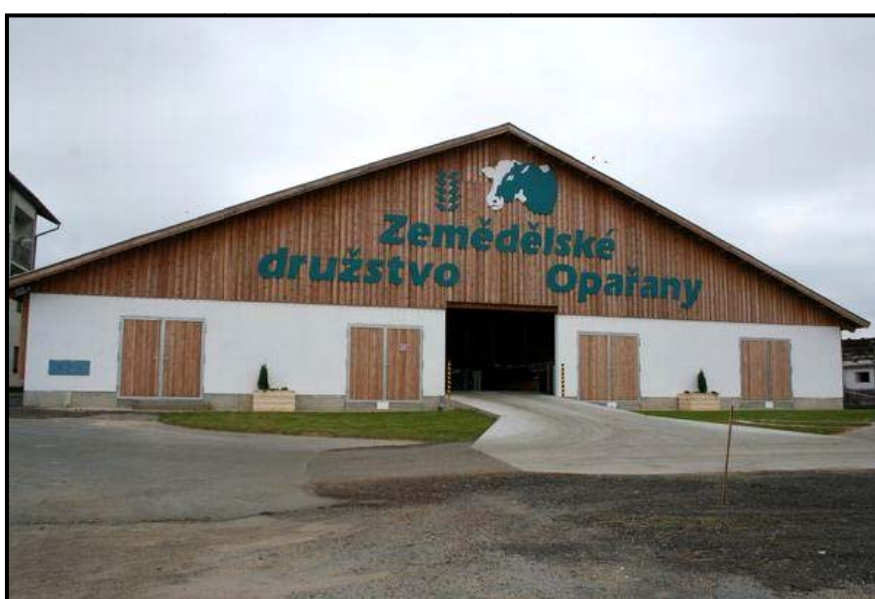
Obr. Novostavba kravína pro 384 ks dojnic, v r. 2009