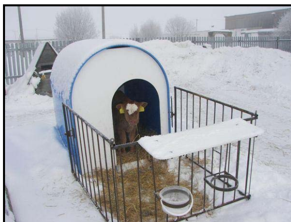
Obr. VIB v Opařanech

Celkový stav zvířat v chovu prasat je 6.000-7.000 kusů prasat, z toho je cca 600 ks prasnic a 30 ks plemenných kanců. V Zemědělském družstvu Opařany se každým rokem pořádá tradiční výstava plemenného skotu v Řepči. Výstava je navštěvovaná řadou zemědělských odborníků z celé republiky.