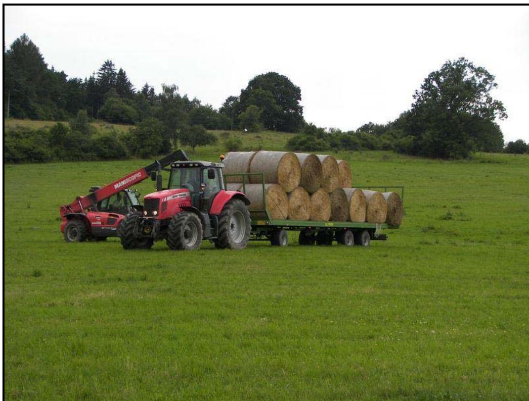
Obr. Svoz balíků