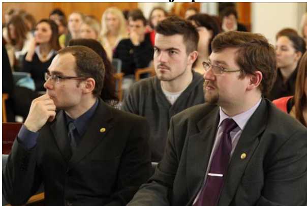
Spoluorganizátorem byl Klub přátel sýrů, který oslavil 8. února druhé výročí existence