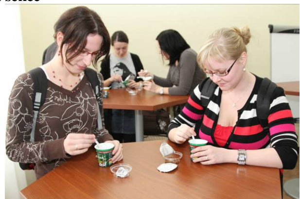
Součástí akce byla ochutnávka mléčných výrobků firem, zde firmy DANONE