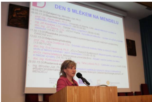
Akce se konala v rámci ID2012 na MENDELU již podruhé