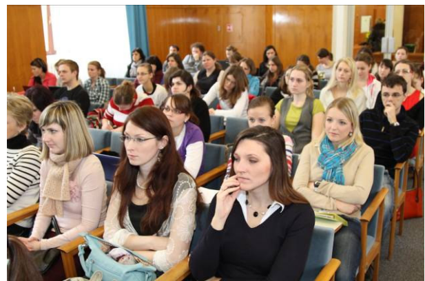
Klíčovou skupinou jsou především studenti vysokých škol