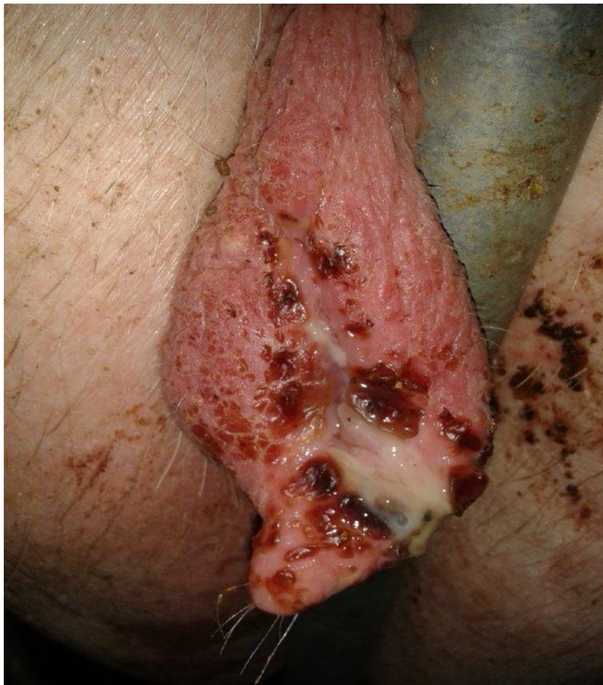
Zduření vulvy u prasat v důsledku zkrmování ZEN

V současné době je známo více než 300 mykotoxinů, které se vyznačují větší či nižší toxicitou. V některých případech jsou mykotoxiny rovněž součástí léčiv. Pro pochopení vzniku mykotoxinů je zapotřebí mít znalosti o vláknitých houbách – plísních.