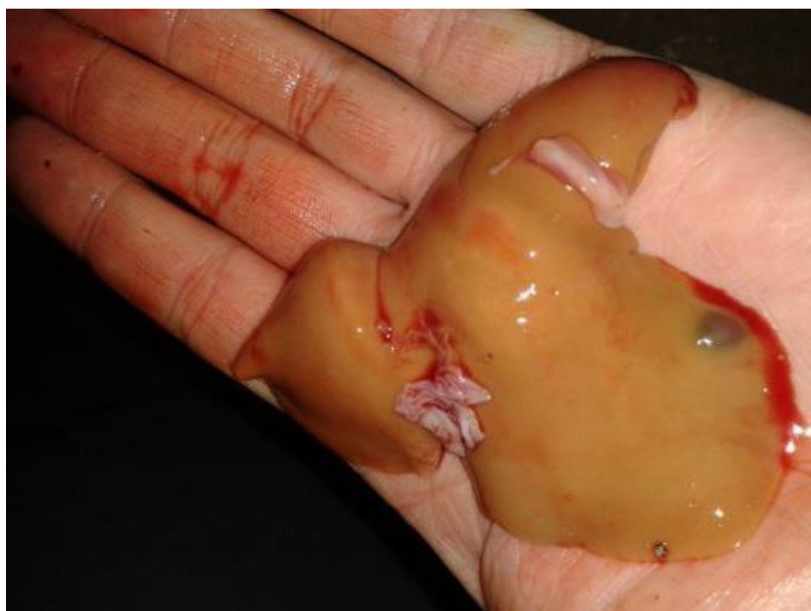
Poškození jater při zkrmování DON

Působení mykotoxinů má poměrně silný kumulativní účinek a jejich efekt (toxicita) je zvyšován spolupůsobením dalších zátěžových faktorů, včetně kombinace více mykotoxinů. Nejčastější dopad kontaminace krmiva mykotoxiny na živočišnou produkci je však subklinický.