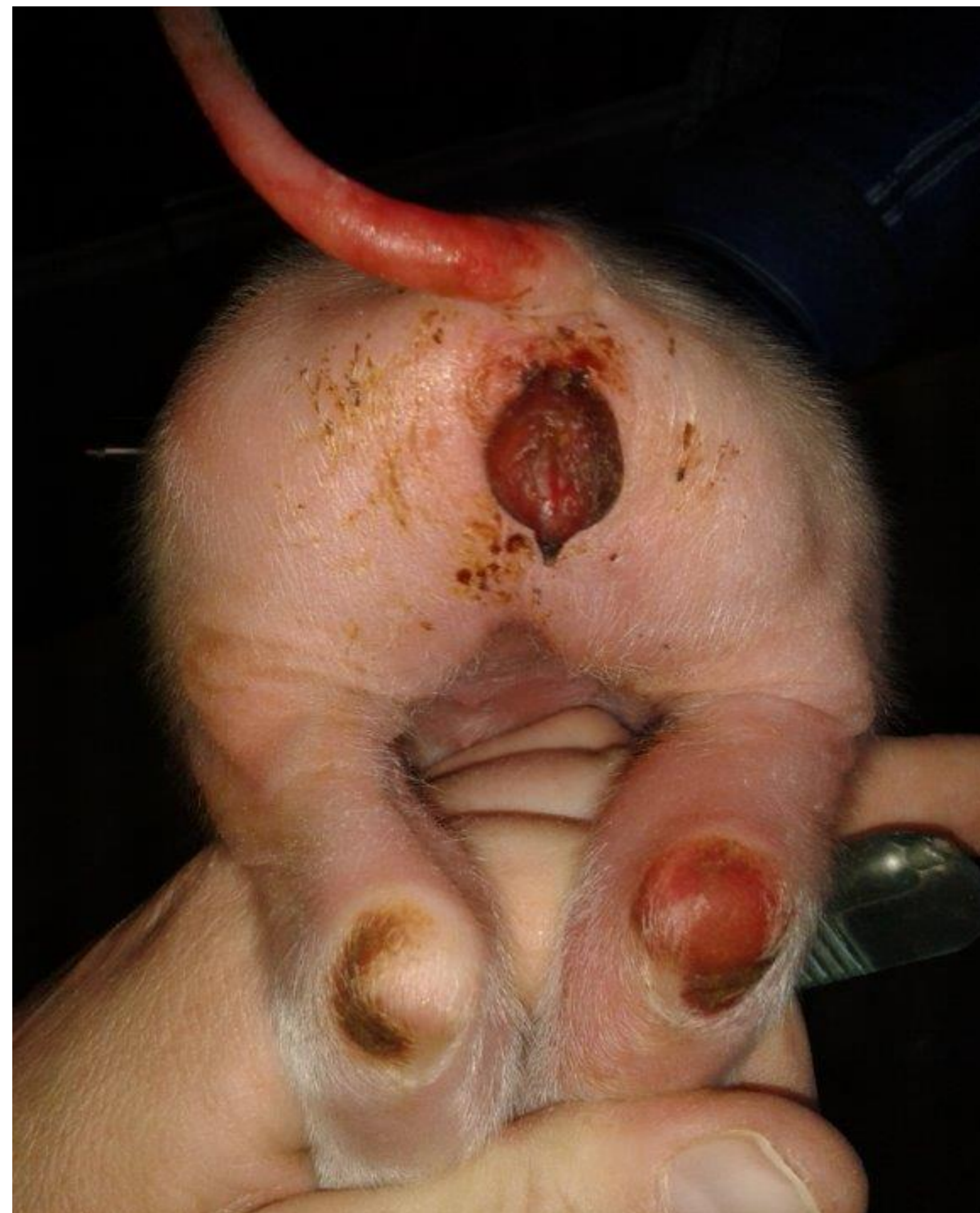
Zduření vulvy u prasat v důsledku zkrmování ZEN

Působení mykotoxinů má poměrně silný kumulativní účinek a jejich efekt (toxicita) je zvyšován spolupůsobením dalších zátěžových faktorů, včetně kombinace více mykotoxinů. Nejčastější dopad kontaminace krmiva mykotoxiny na živočišnou produkci je však subklinický.