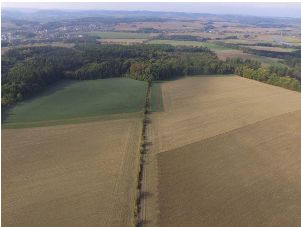
Letecký pohled na řešené území (vpředu Kulatý remízek a Císařův les)

Krajinné prvky, které jsou předmětem historické analýzy v kap. II.3.8 lze v rámci dnešní kategorizace kultur a druhů pozemků, evidovaných vektorovým státním mapovým dílem, zařadit do entit: