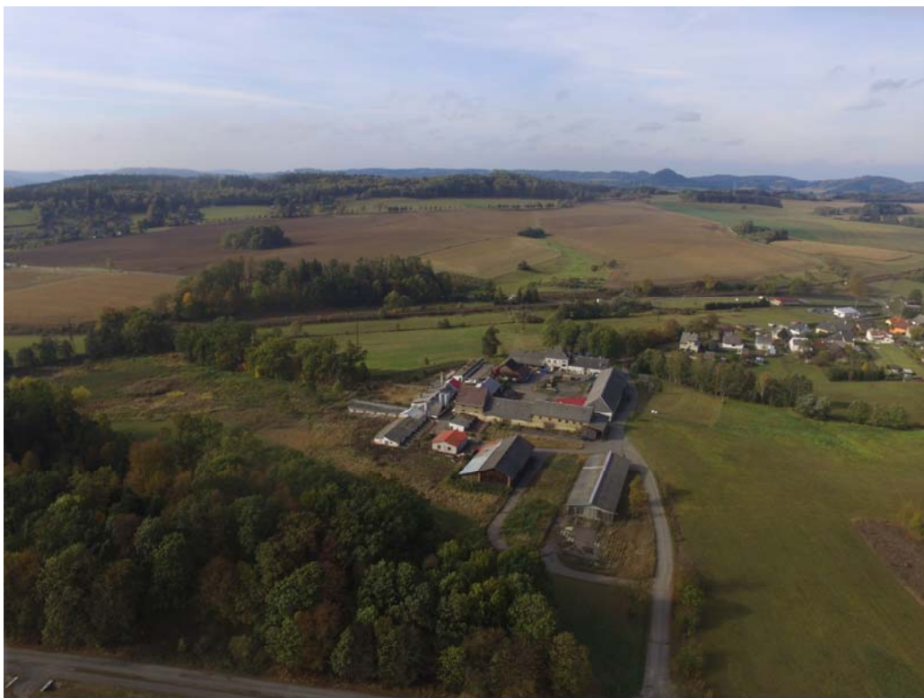
Letecký pohled na Lukavický dvůr