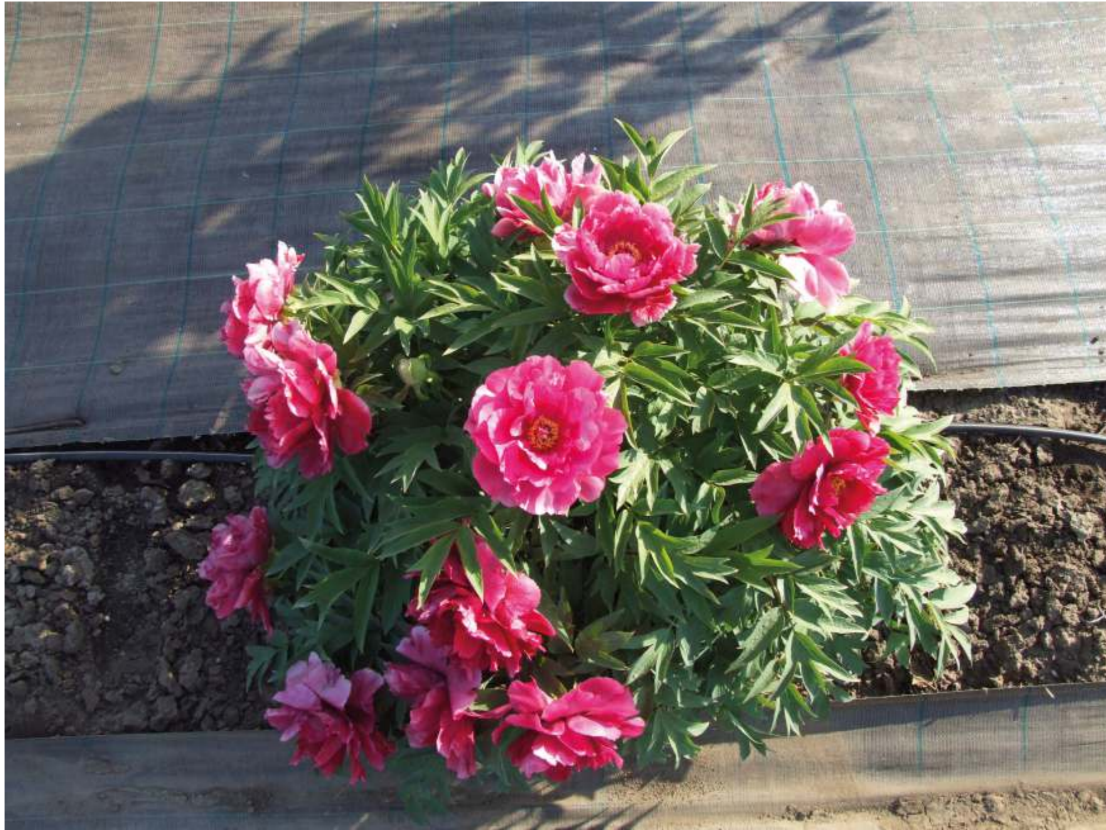
Obr. 1: Habitus dřeviny Paeonia suffruticosa

Pivoňka keřovitá představuje široký komplex původních typů. Vyskytují se v obrovském rozsahu v Čínských provinciích Anhui, Gansu, Henan, Shanxi, Sichuan a Yunnan. Velmi často je lze nelézt poblíž klášterů, kde byly pěstovány pro okrasnou a léčivou funkci. Dřevité pivoňky byly pěstovány v Číně po více než 1500 let a do současnosti tam bylo uznáno více jak 500 kultivarů. Byla poprvé popsána v roce 1804 na základě rostlin pěstovaných v anglických zahradách. Do Evropy byly první rostliny dovezeny v roce 1787. Kulturní dřevitá pivoňka s květy plnými, poloplnými a vzácně jednoduchými nejrůznějších barev v odstínech od bílé přes růžovou po tmavě červenou.