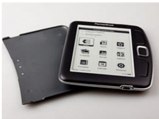
PocketBook a jednoduché pouzdro

Na rozdíl od konkurenčních čteček nemusíte shánět žádné extra pouzdro, součástí je totiž plastové víko, které lze odejmout a s trochou cviku přichytit zepředu, aby chránilo displej, a také zezadu, aby nepřekáželo nebo se neztratilo. Zpočátku to byl oproti koženému pouzdru Kindle trochu nezvyk, ale celkem rychle jsem objevil výhodu pouzdra: nijak zásadně nezvětšuje objem už tak malé čtečky.