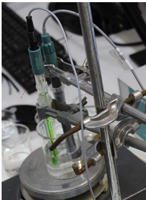
Obr 3. Zapojení elektrod pro měření ve vzorku 1. pracovní elektroda (Cl - ) 2. Referenční elektroda